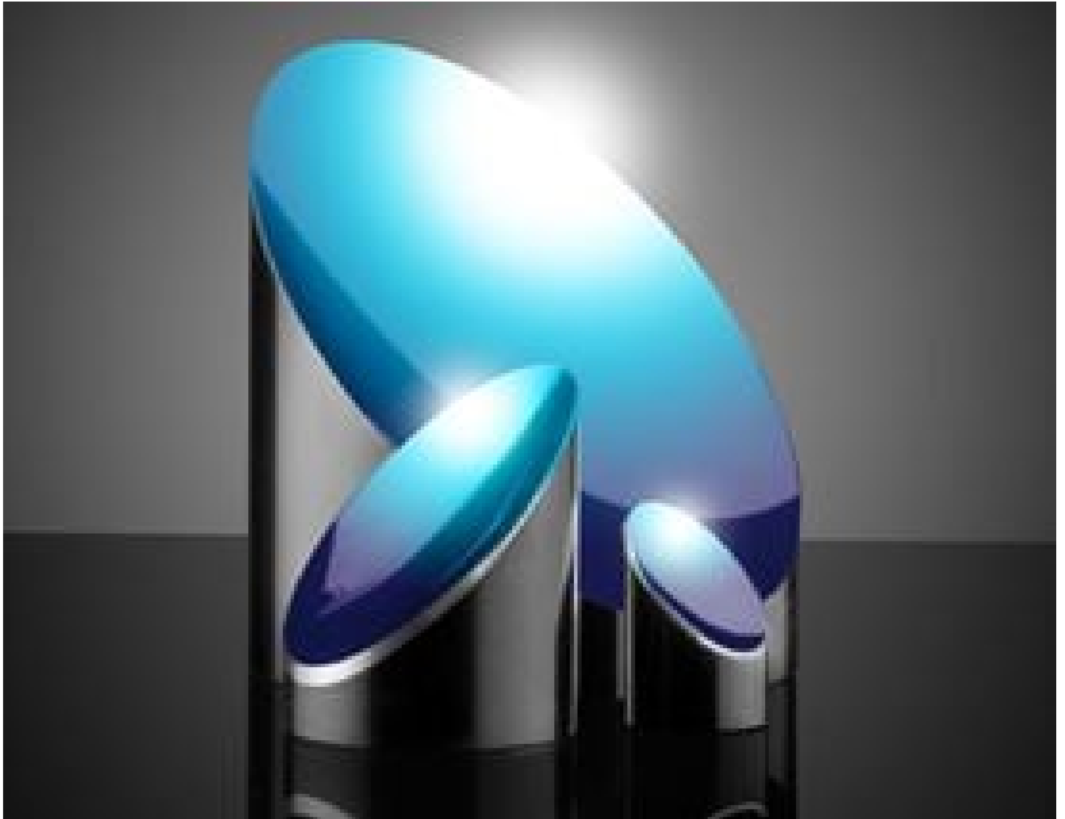
TECHSPEC® Ultrafast-Enhanced Silver Coated Off-Axis Parabolic (OAP) Mirrors