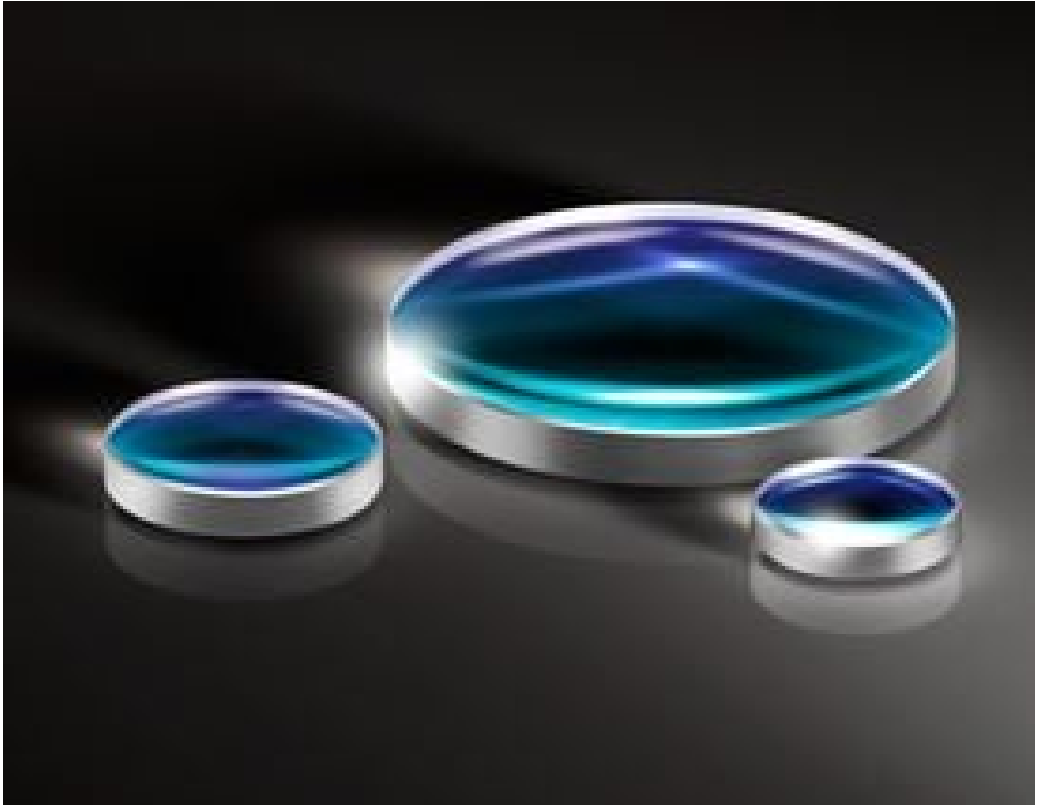
UV Fused Silica Double-Convex (DCX) Lenses