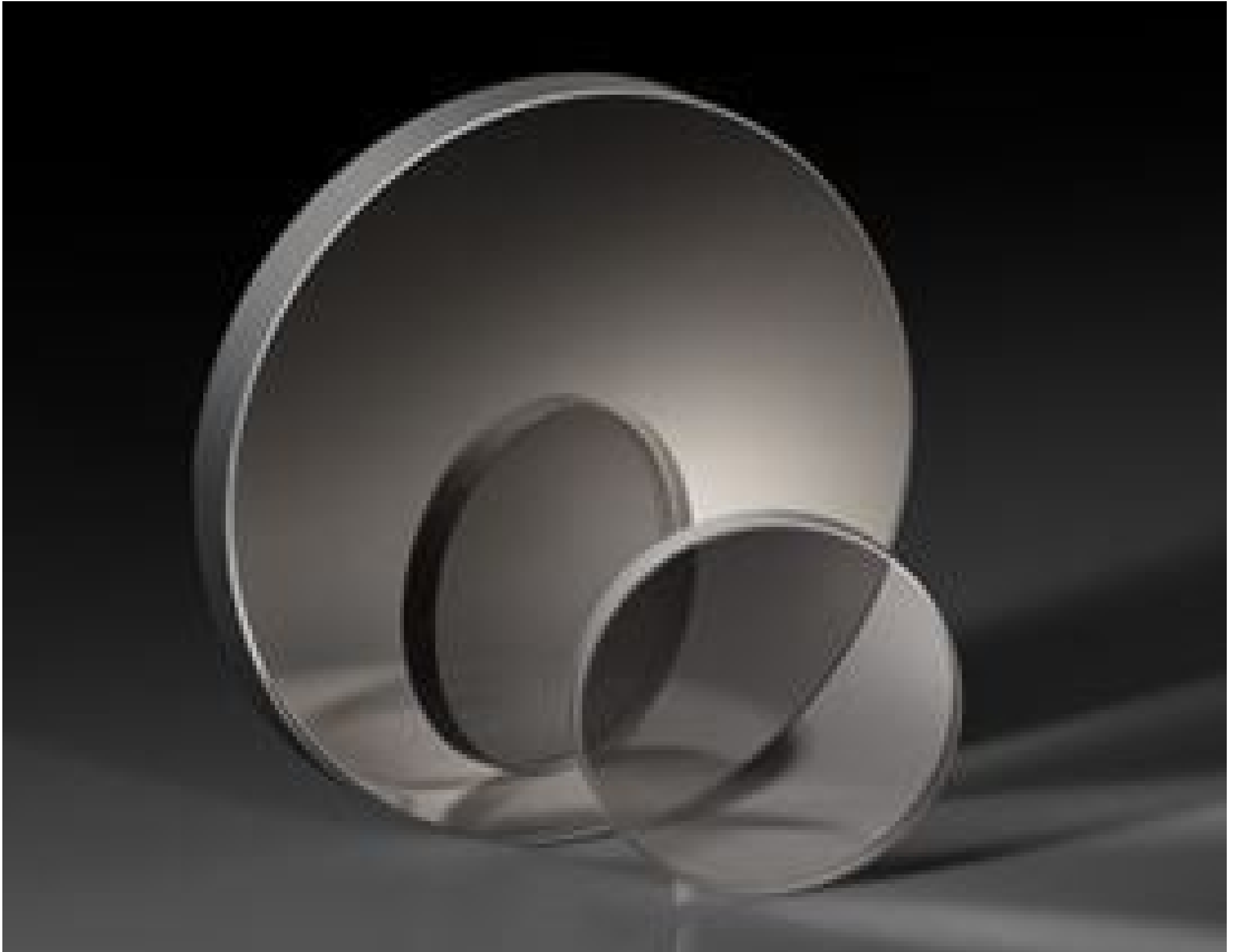
Near-IR (NIR) Neutral Density (ND) Filters