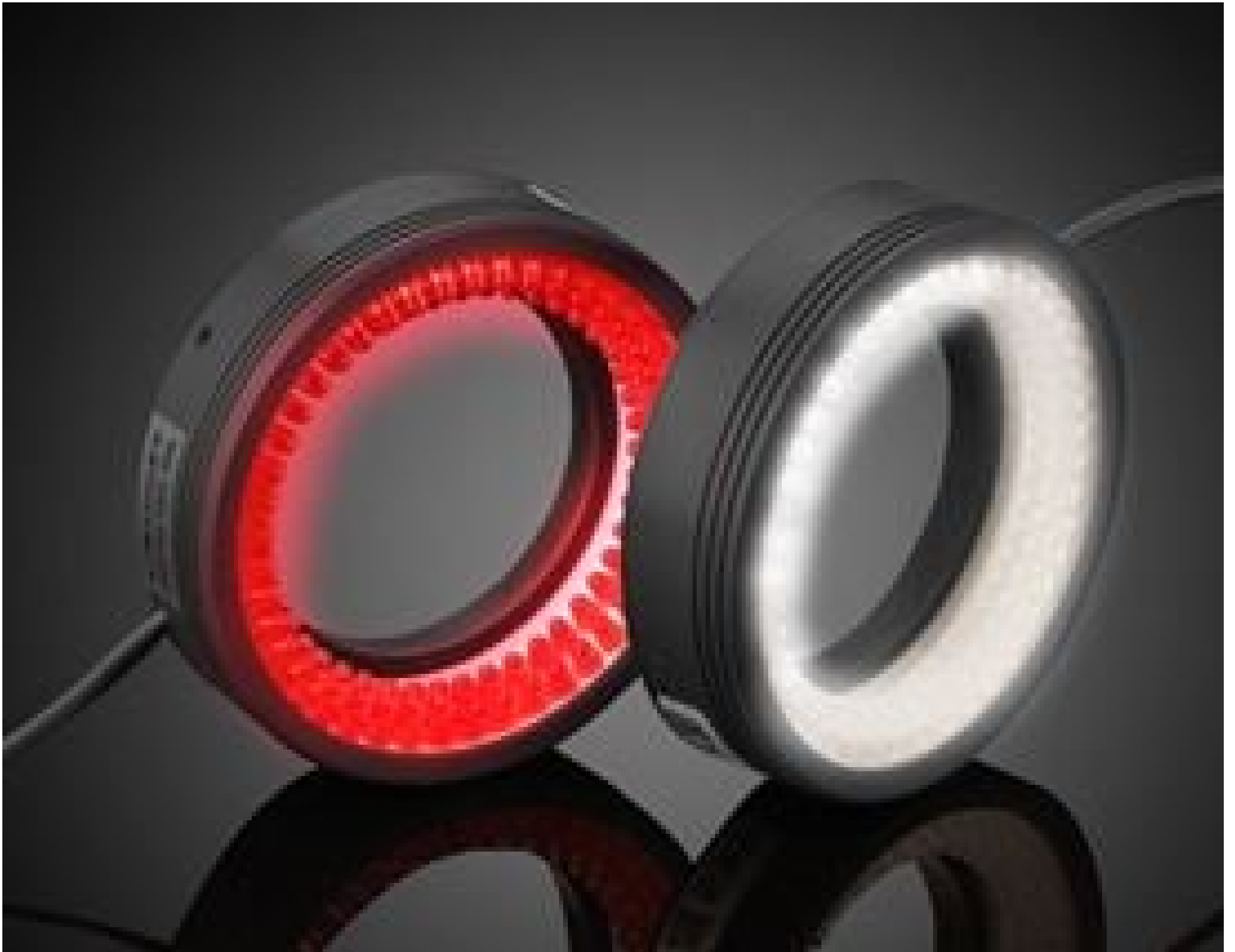
CCS Low-Angle LED Ring Lights