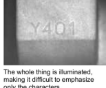
LED Dome Light

The whole thing is illuminated, making it difficult to emphasize only the characters.