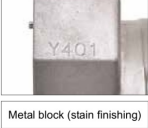
Metal block (stain finishing)