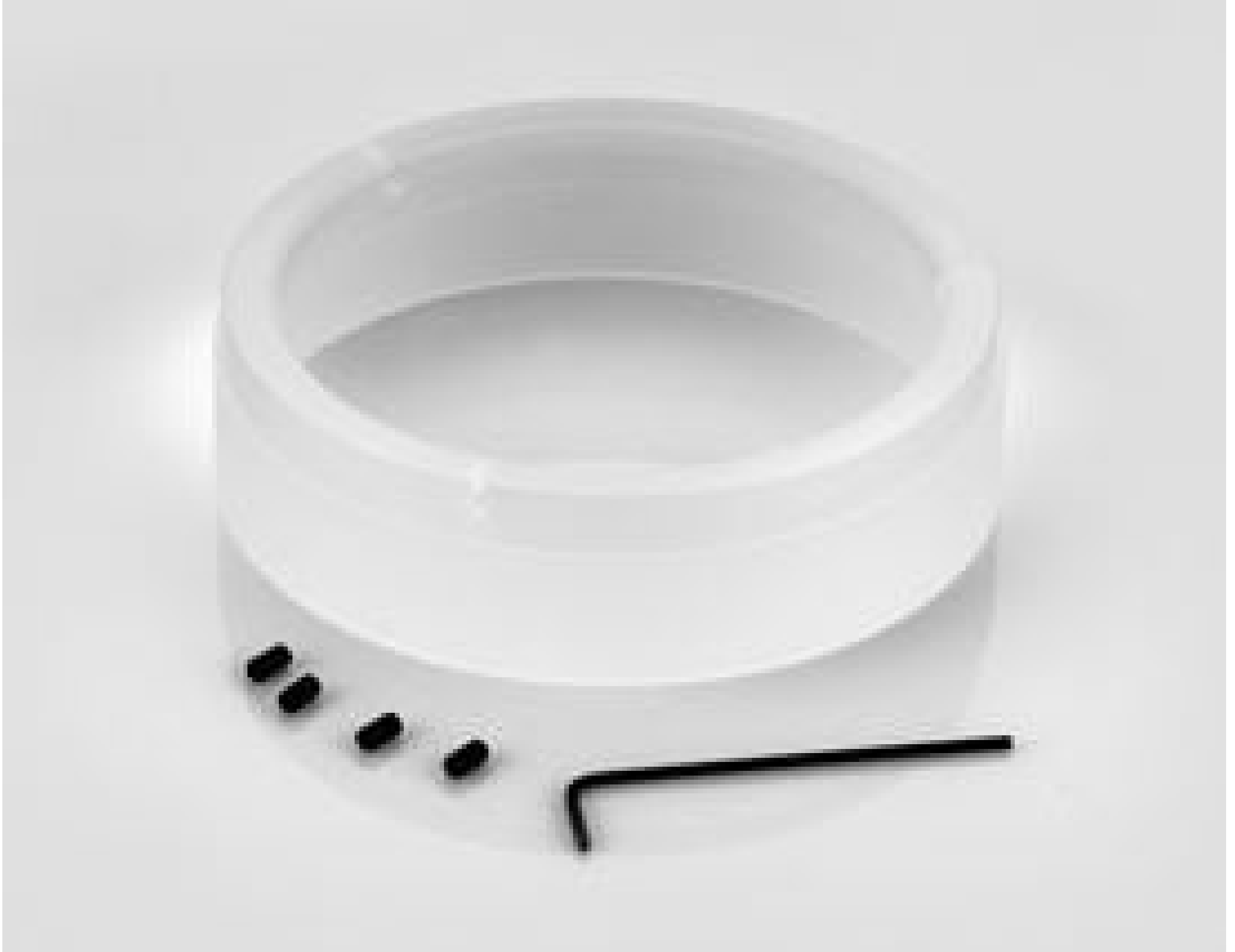
Ring Diffusion Plate