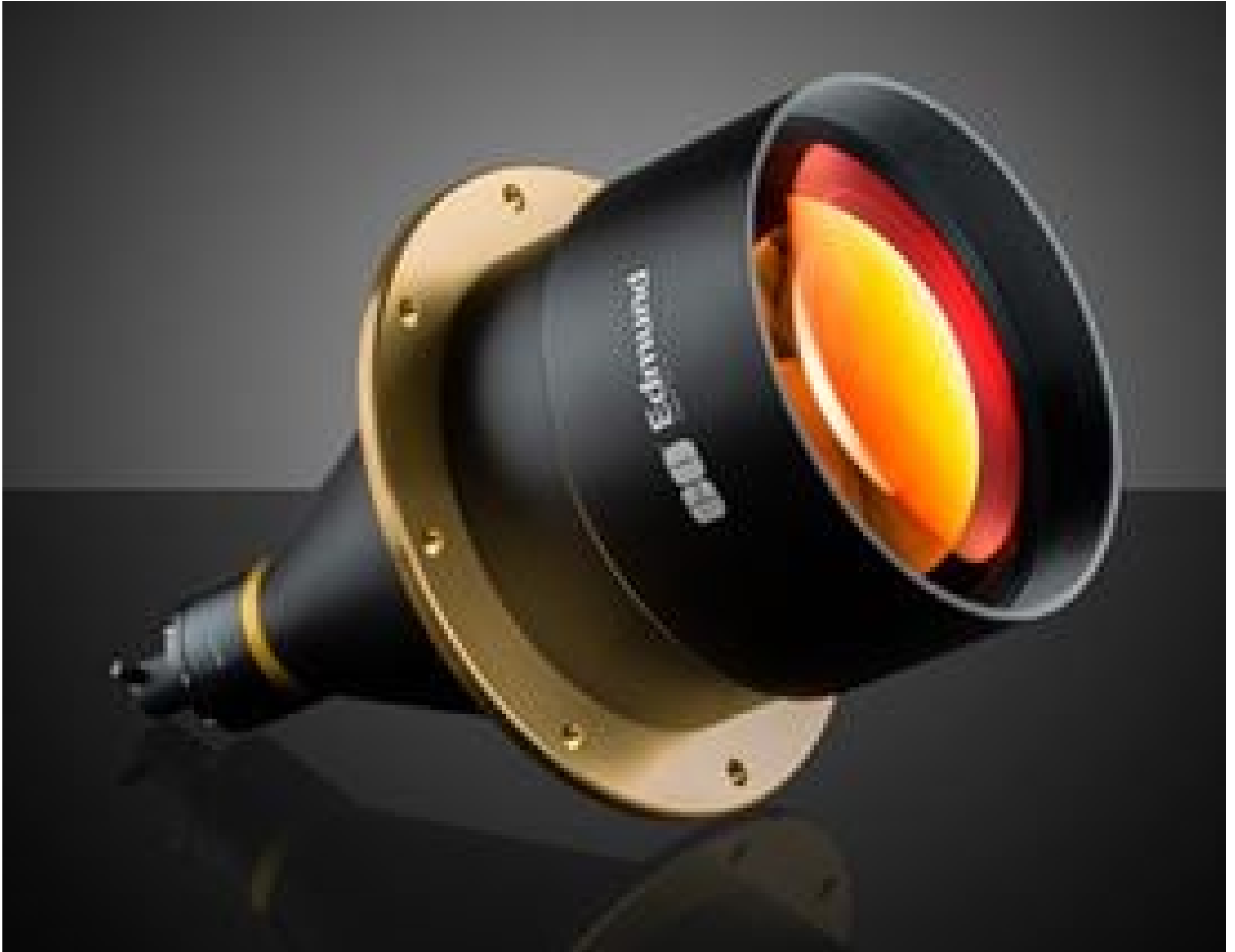
138mm Telecentric Backlight Illuminator, #35-427