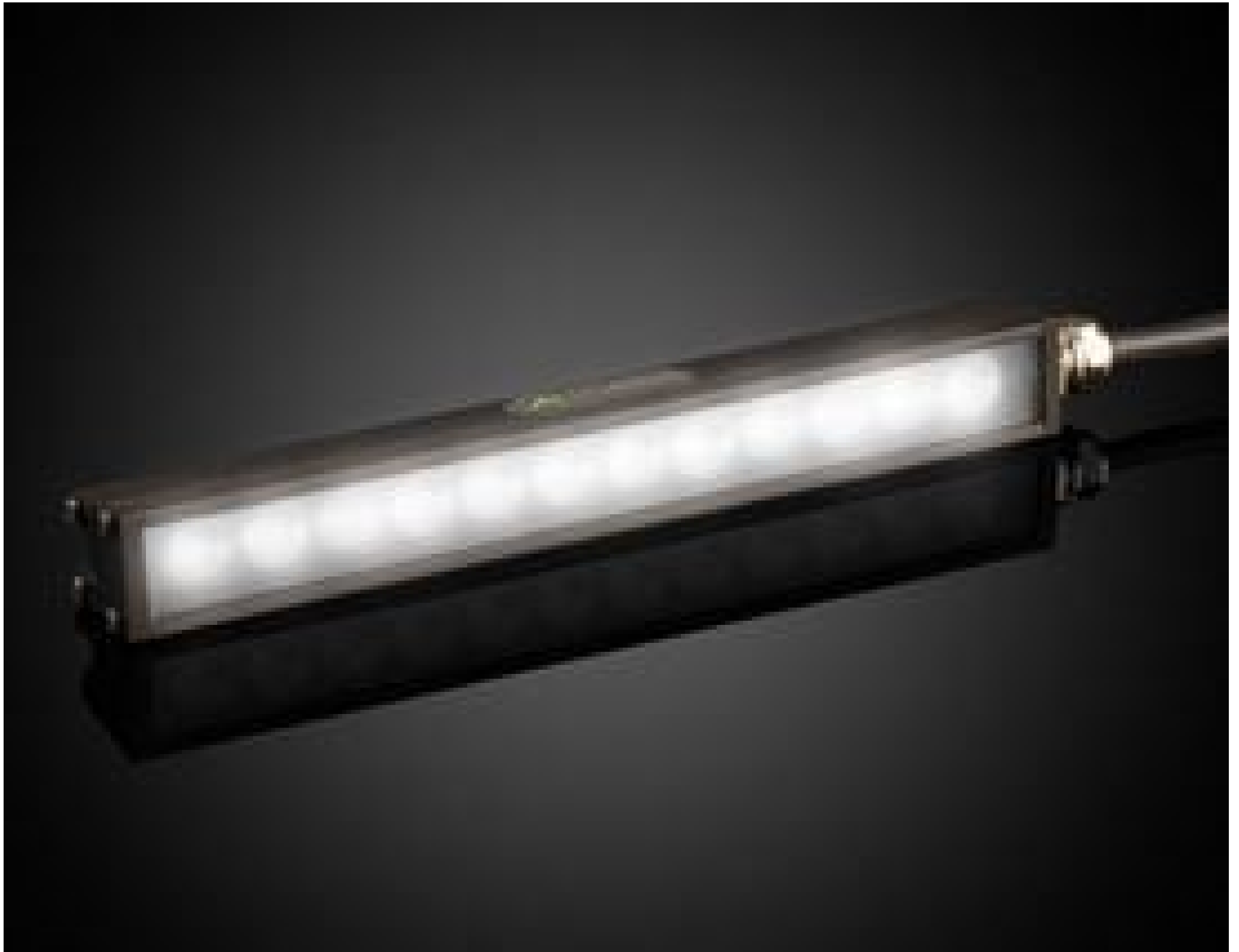
Advanced Illumination MicroBrite Ultra High Intensity Bar Light