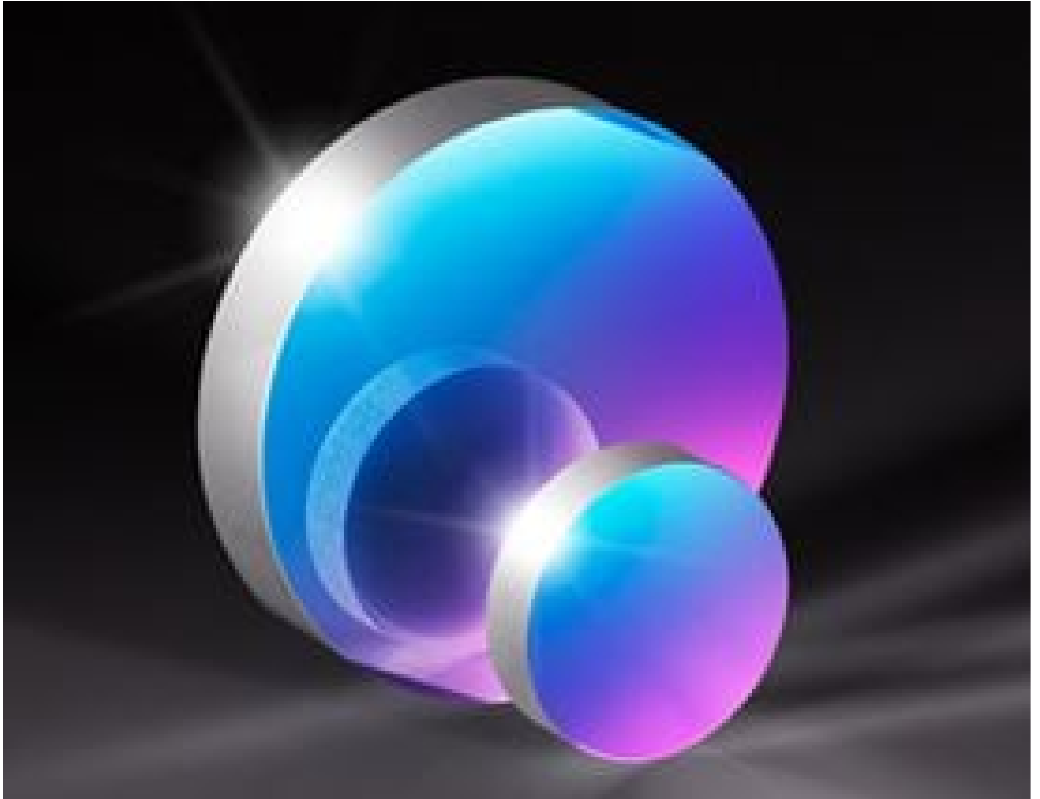
Precision Ultraviolet Mirrors