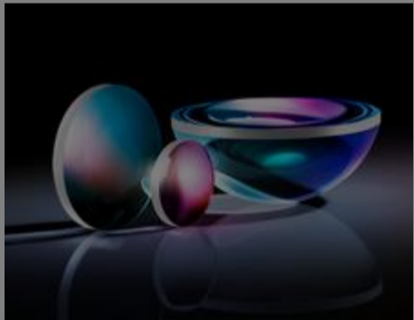
#32-000 - Plankonvexe Linse (PCX), 18 mm D. x 36 mm BW, unbeschichtet €32,25