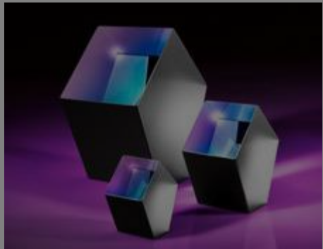
#31-051 - 20mm, MgF 2 beschichtet, Pentaprisma €115,00