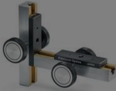
#03-600 - Präzise Bühne für X-Y-Achse, 40 mm Verstwellweg €451,00