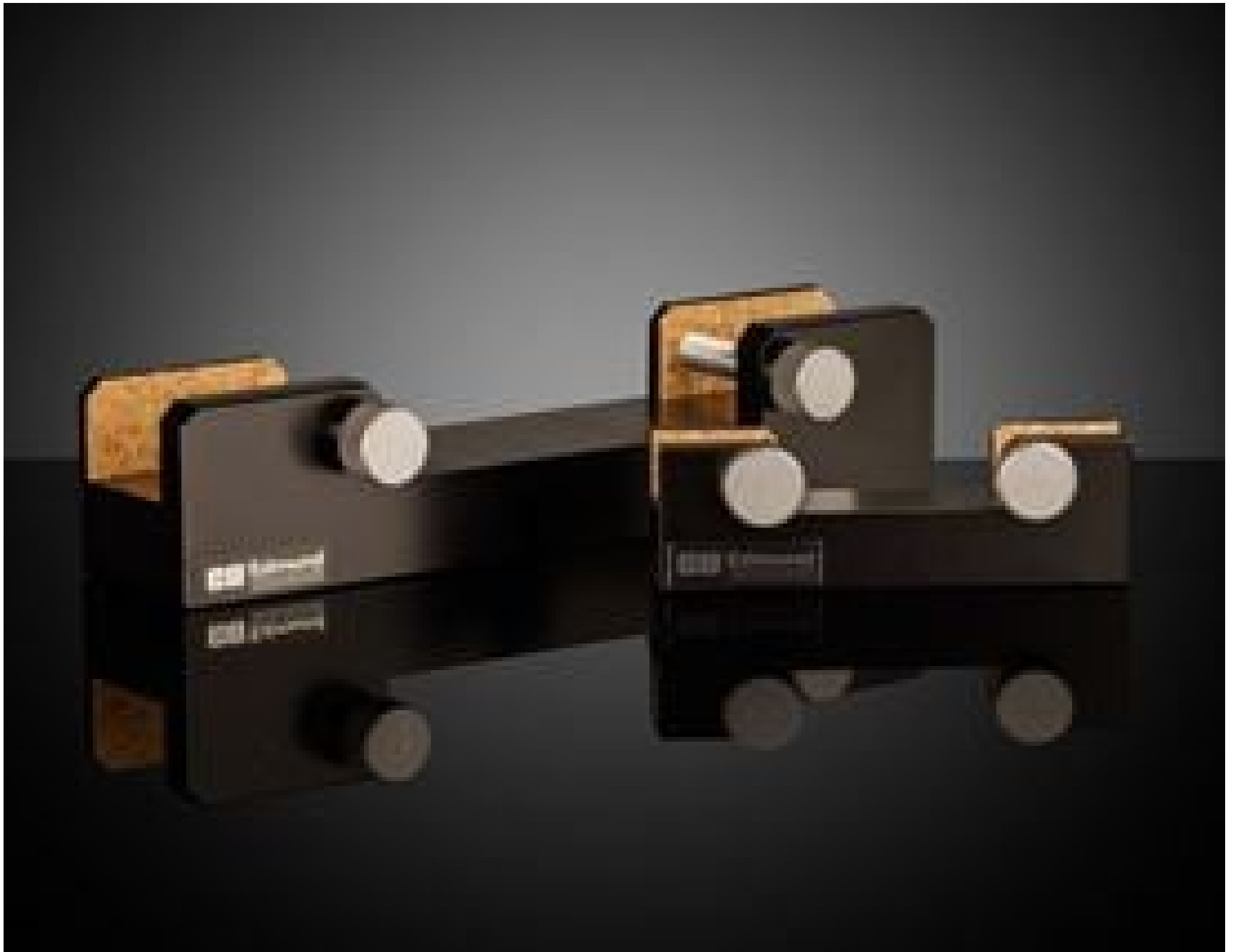
Fixed Filter Mounts