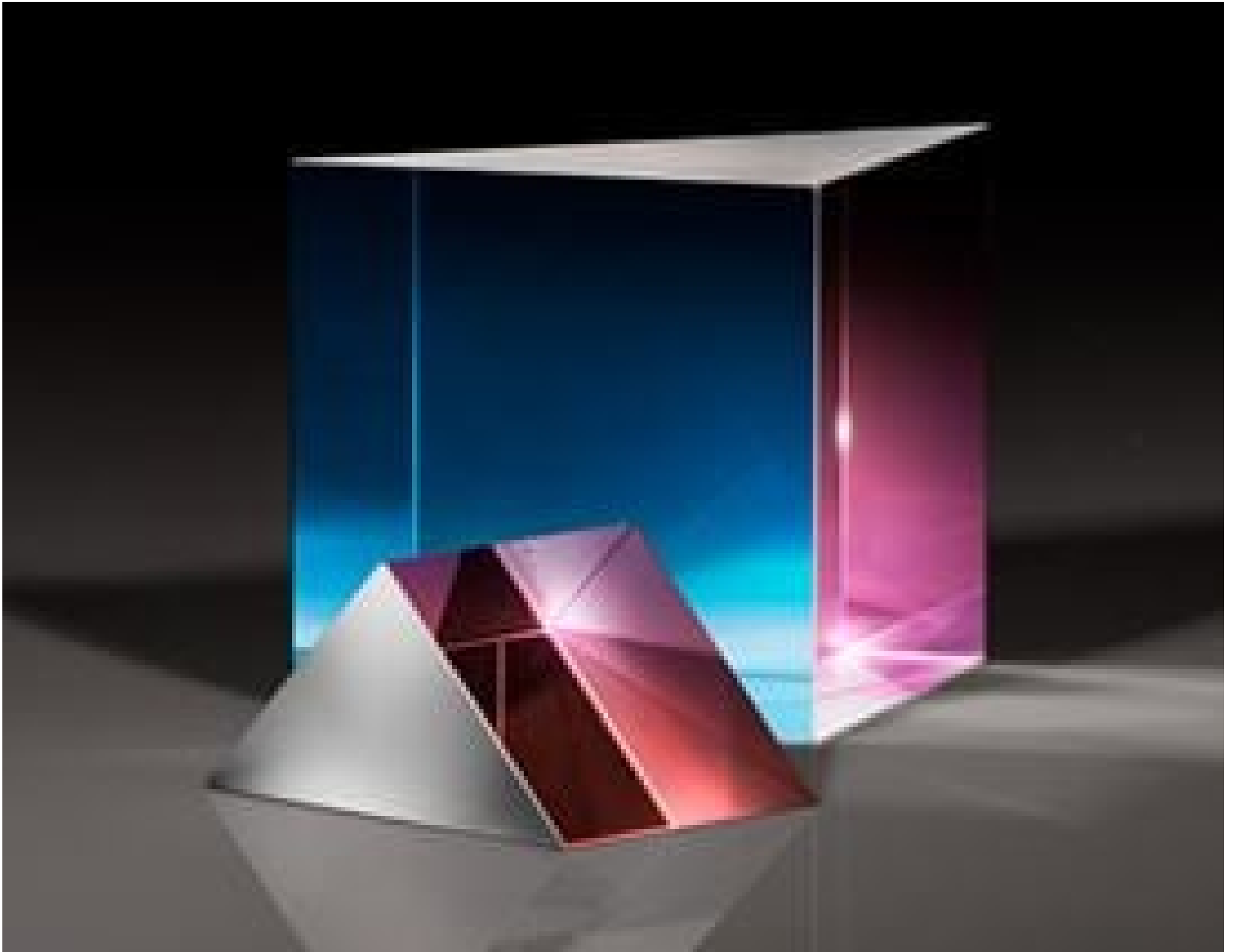
TECHSPEC High Tolerance UV Fused Silica Right Angle Prisms