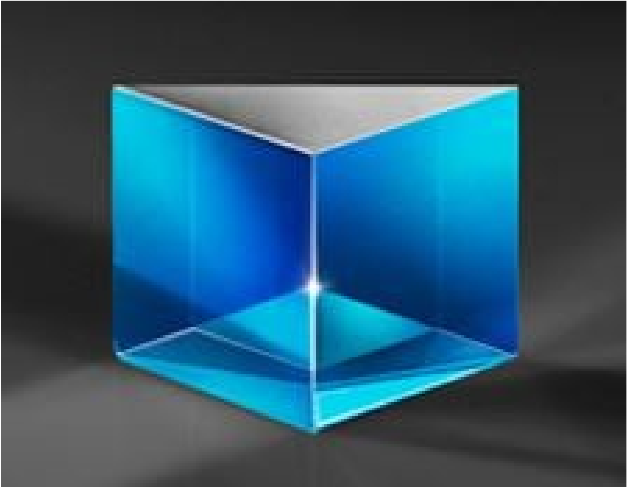
Broadband Anti-Reflection Coated Hypotenuse Prism