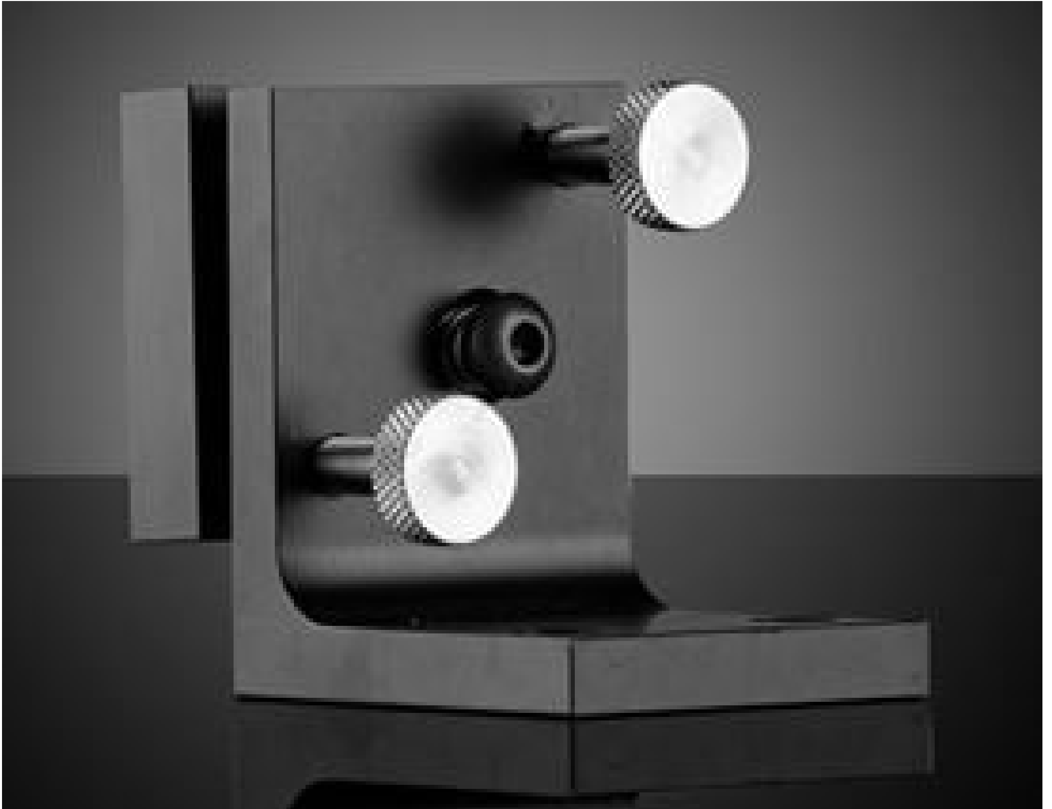
1.5" Reverse Angle Mirror Mount