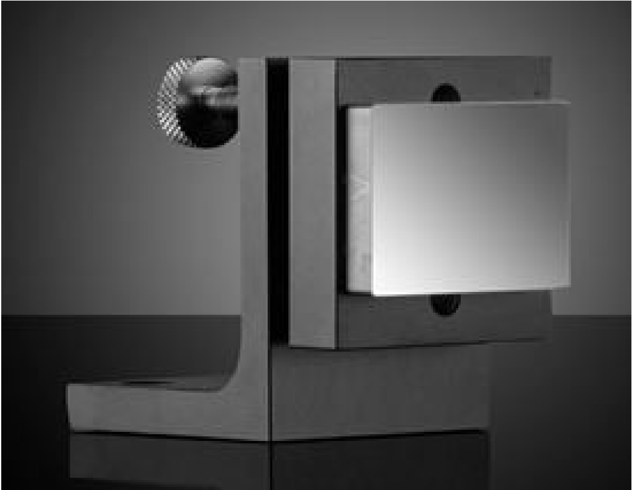
1.5" Reverse Angle Mirror Mount with Mirror