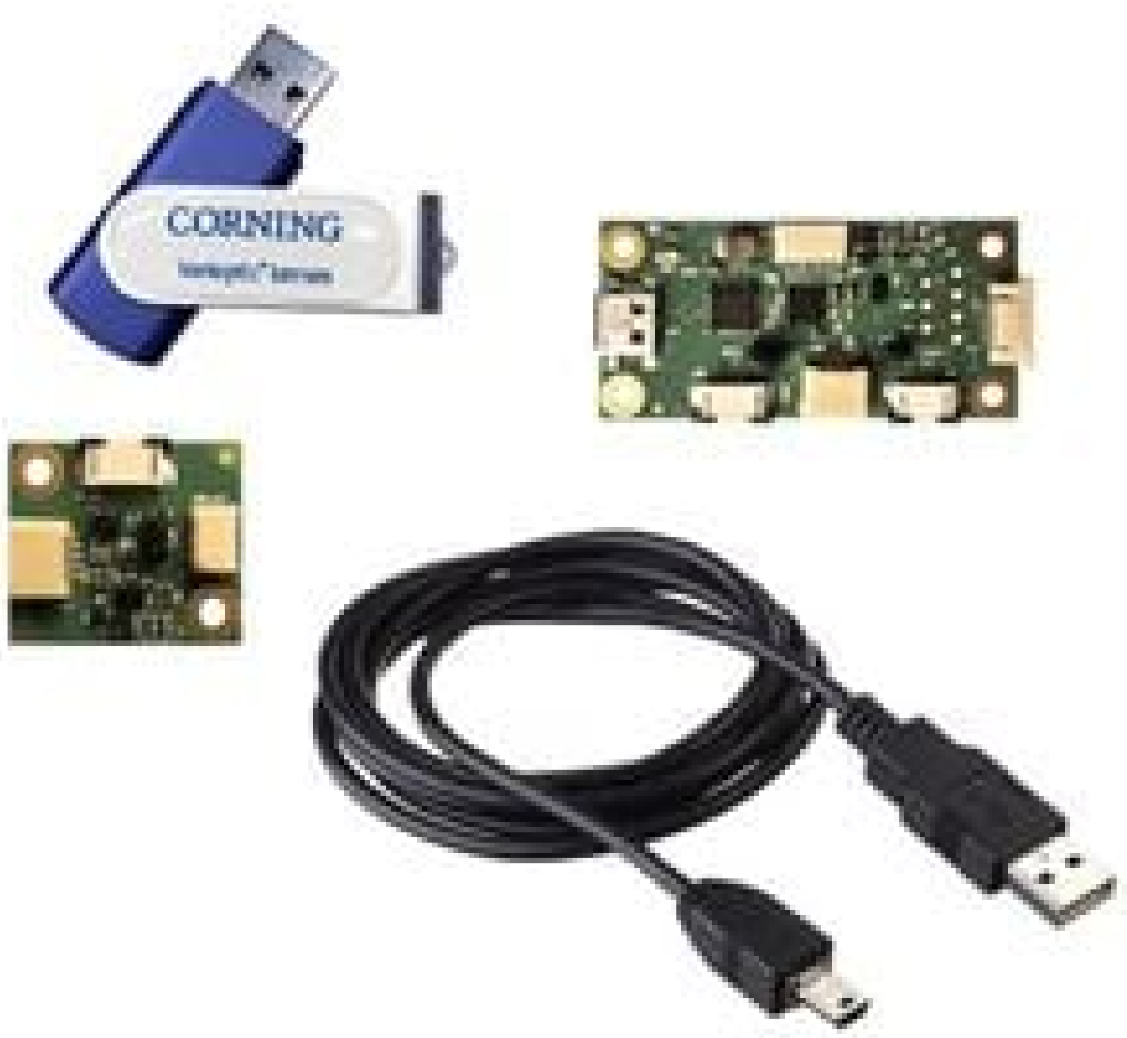
1.6mm CA, Corning® Varioptic® Variable Focus Liquid Lens Development Kit (Included Electronics)