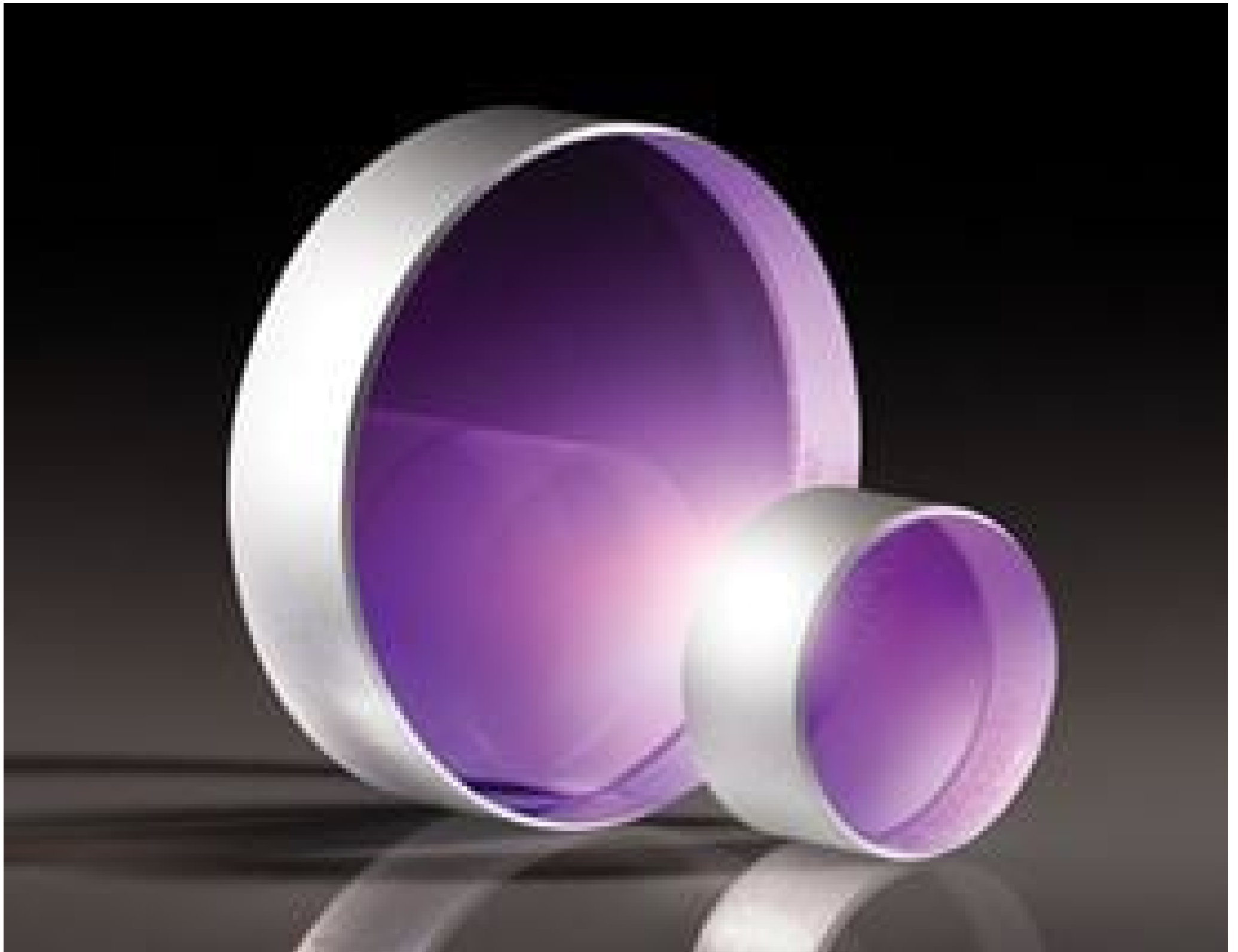
TECHSPEC \lambda/10 Laser Line Coated Windows