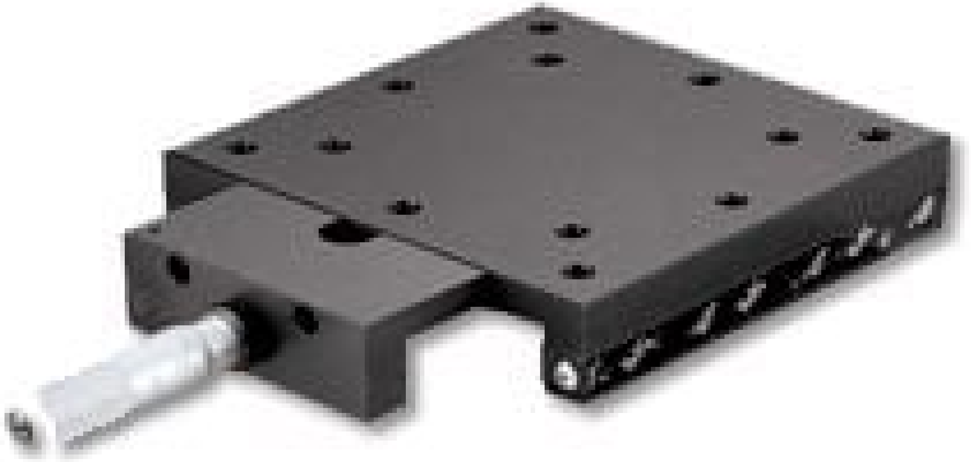
Solid Top Stage