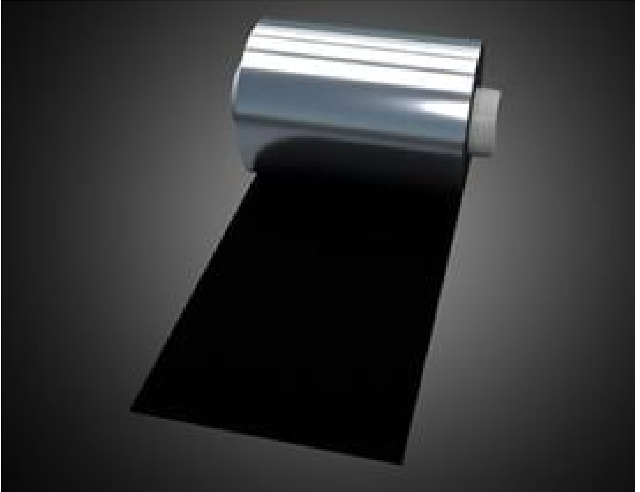
Roll of Spectral Black/Metal Velvet