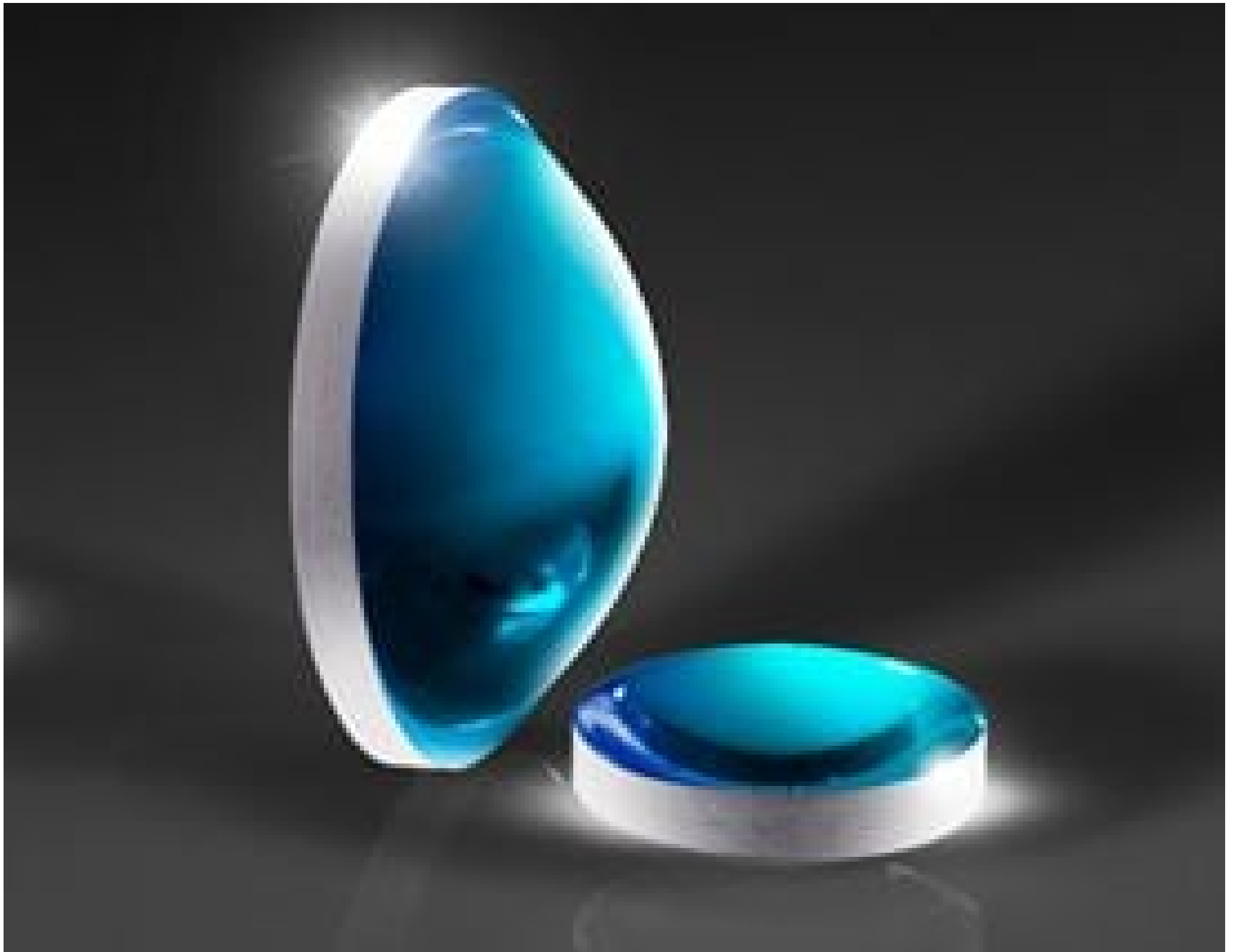
Molded Aspheric Condenser Lenses