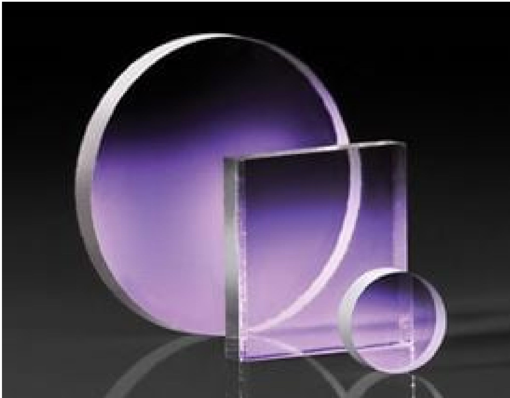
TECHSPEC BOROFLOAT Borosilicate Windows

Mehr Produkte von SCHOTT Optical Components