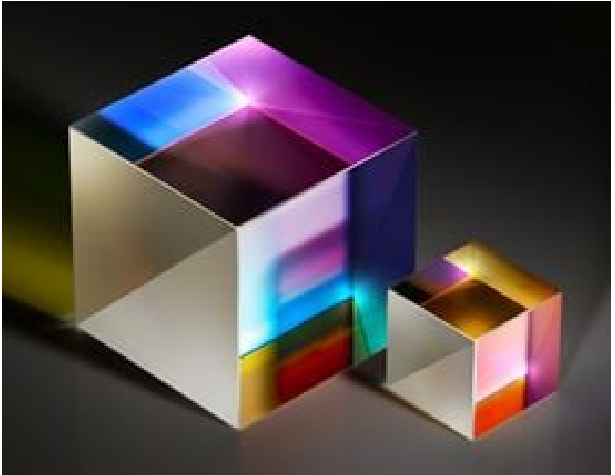
TECHSPEC® Broadband Polarizing Cube Beamsplitters