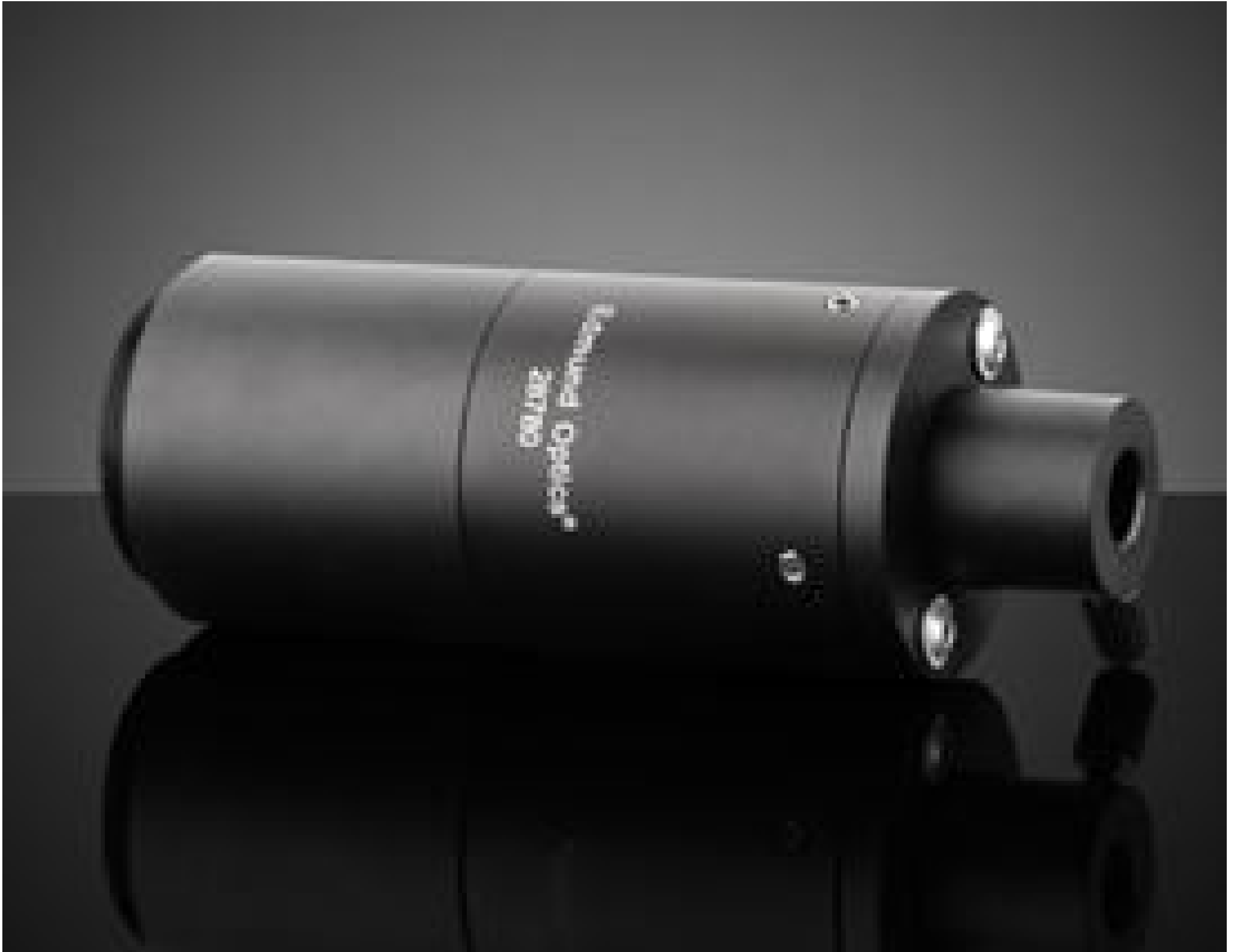
20X Focusing Lens