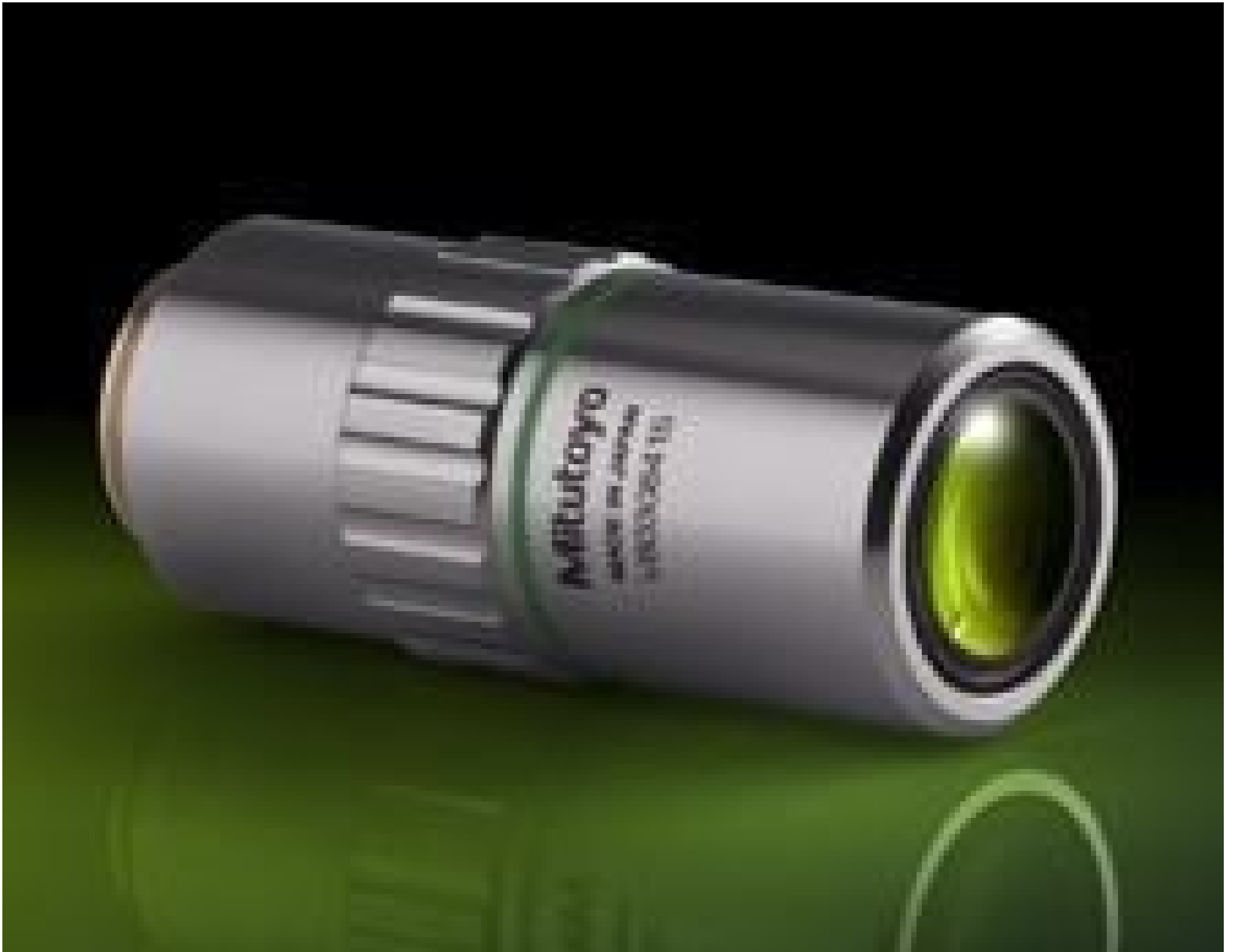
20X Mitutoyo Plan Apo Infinity Corrected Long WD Objective, #46-145