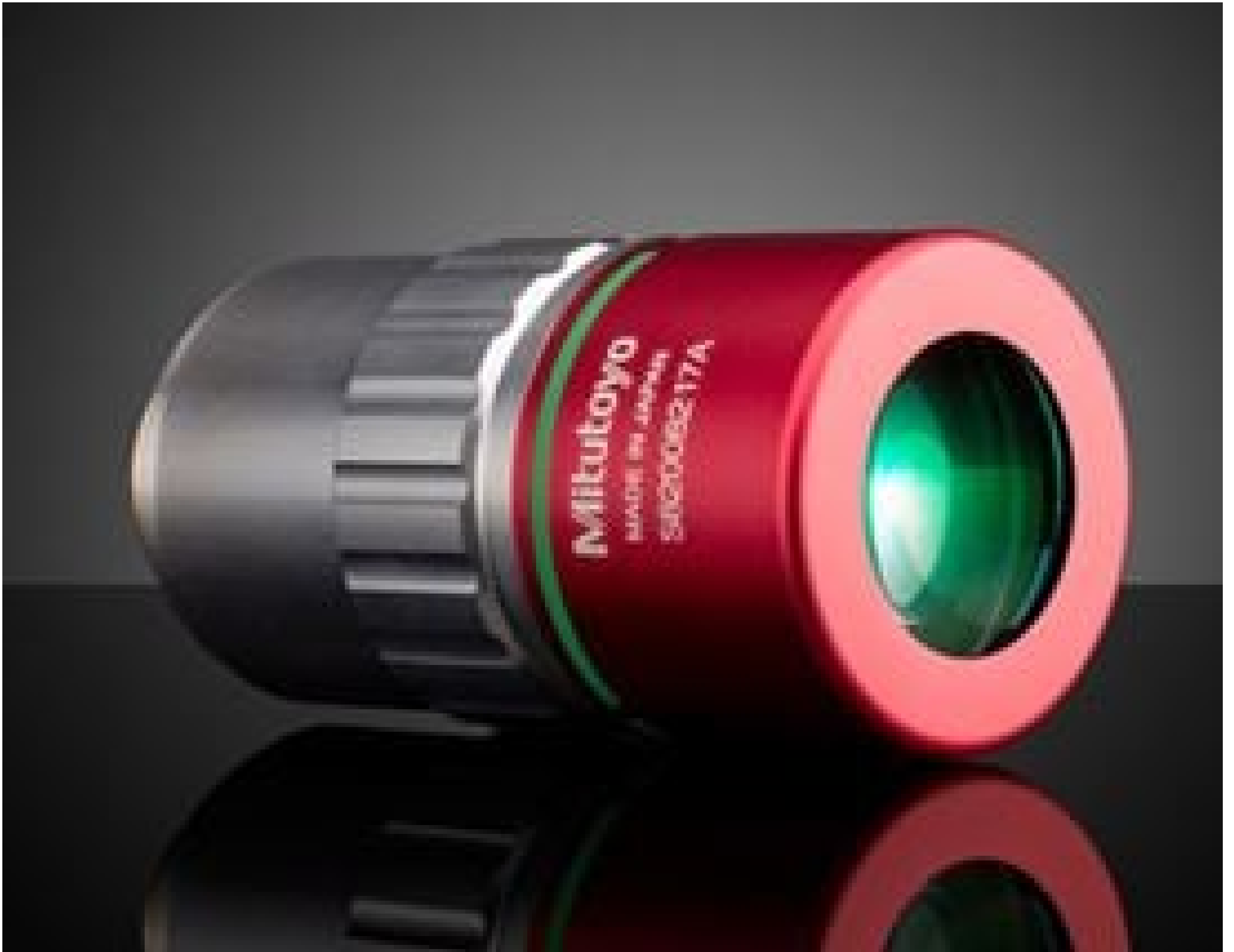
20X Mitutoyo Plan Apo NIR B Infinity Corrected Objective, #89-350