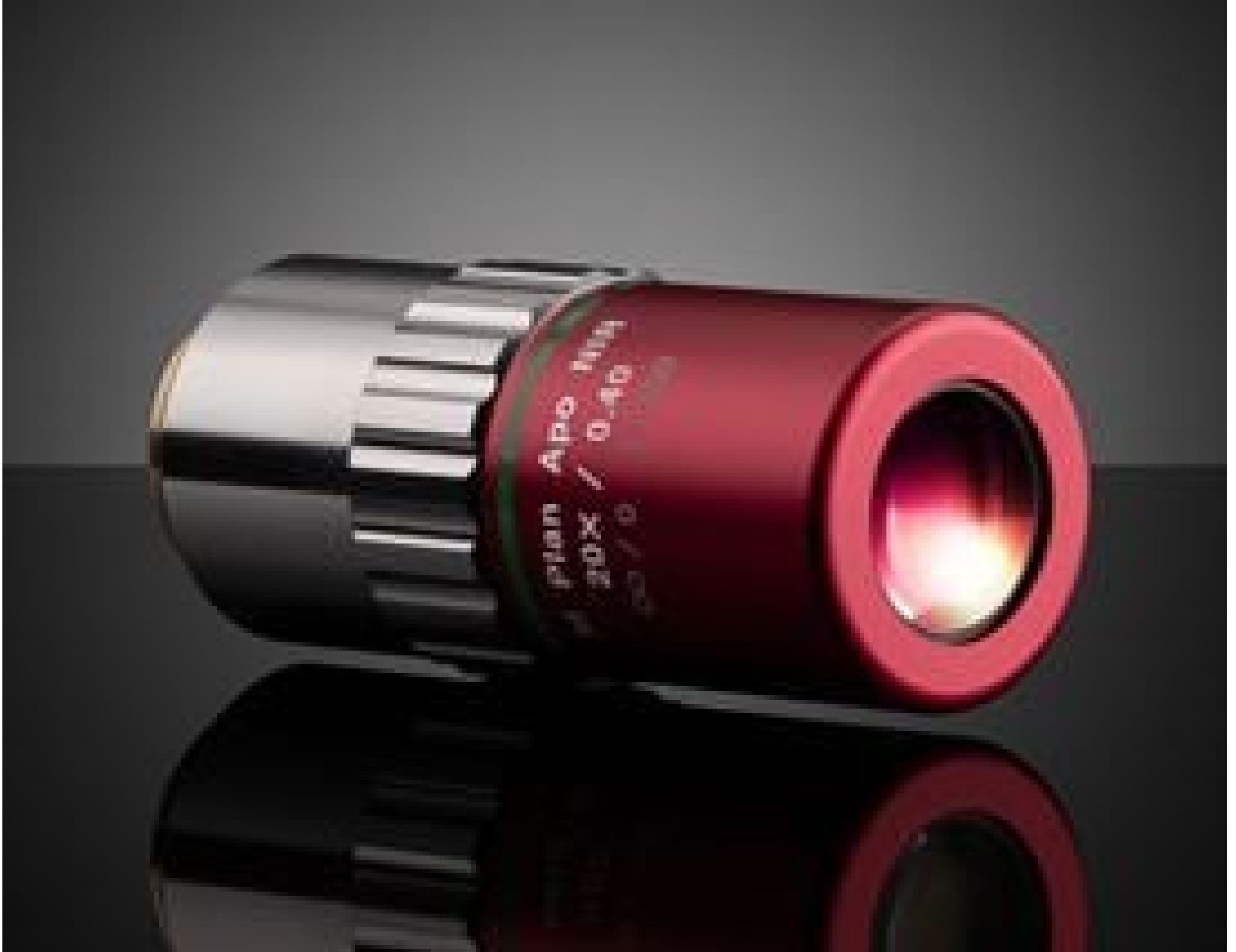
20X Mitutoyo Plan Apo NIR Infinity Corrected Objective, #46-404