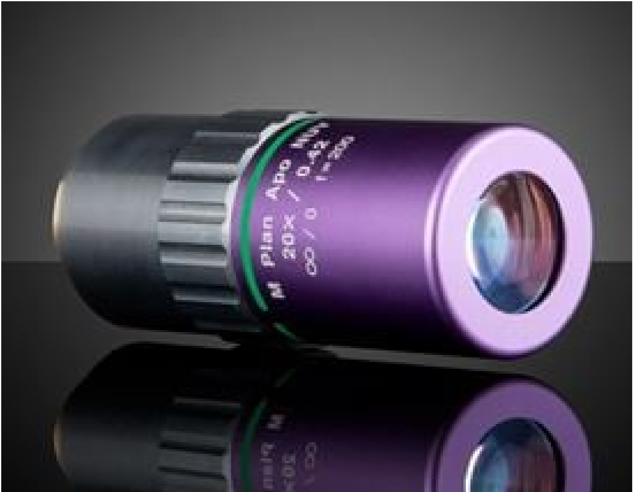
20X Mitutoyo Plan Apo NUV Infinity Corrected Objective, #46-407