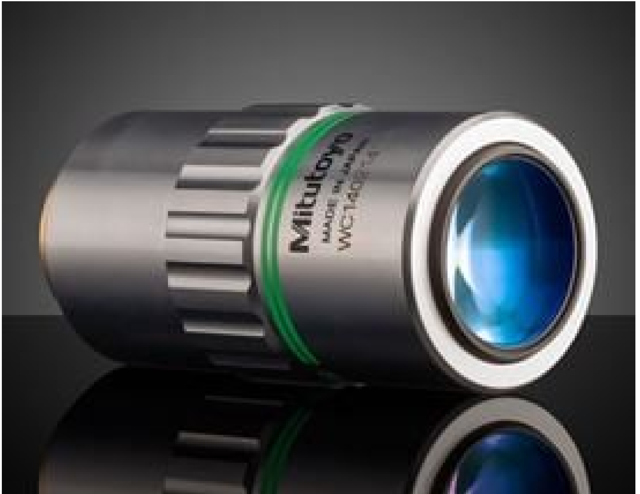
20X Mitutoyo Plan Apo SL Infinity Corrected Objective, #46-398