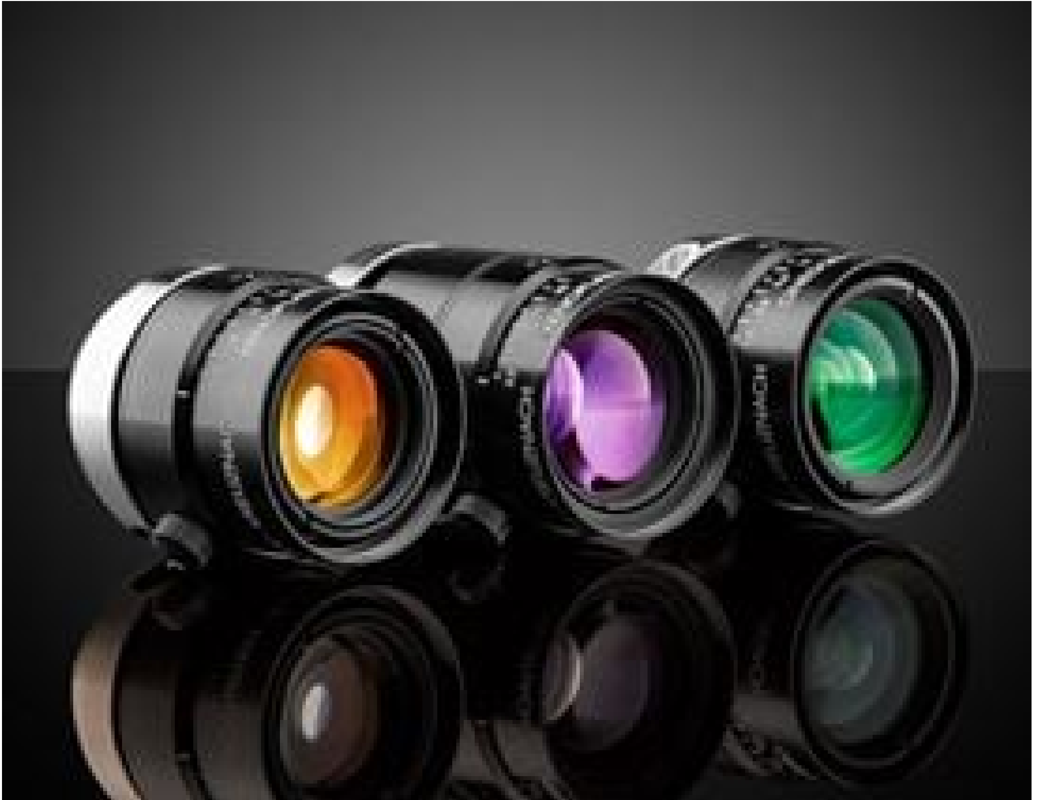
Schneider Compact MS-NIR Lenses