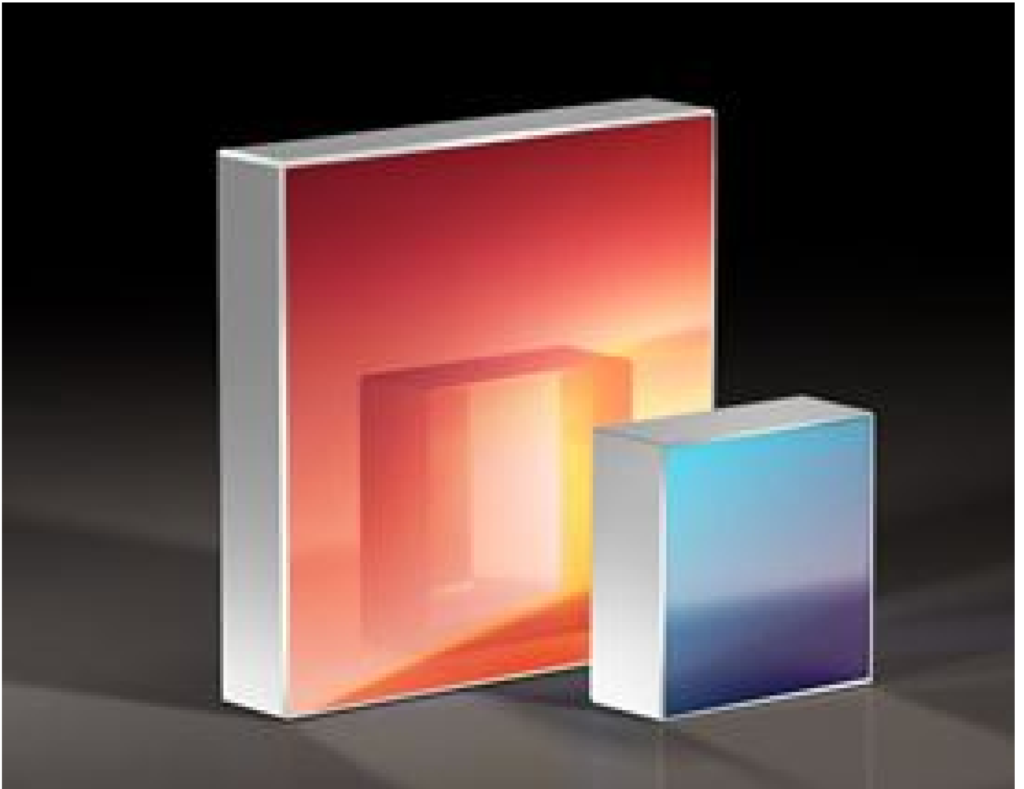
Reflective Holographic Gratings