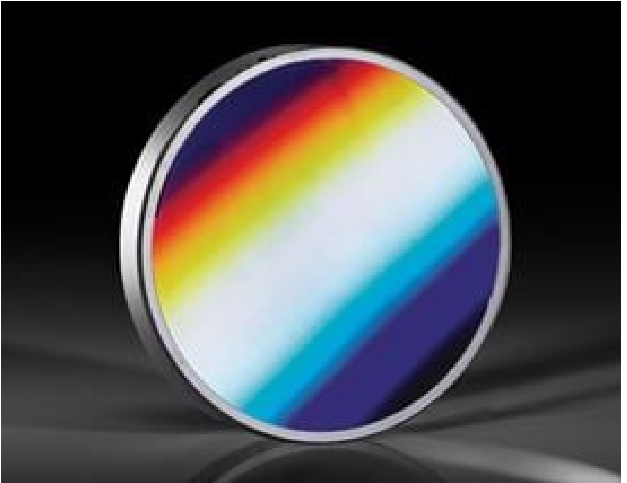
ZEISS Concave Diffraction Gratings