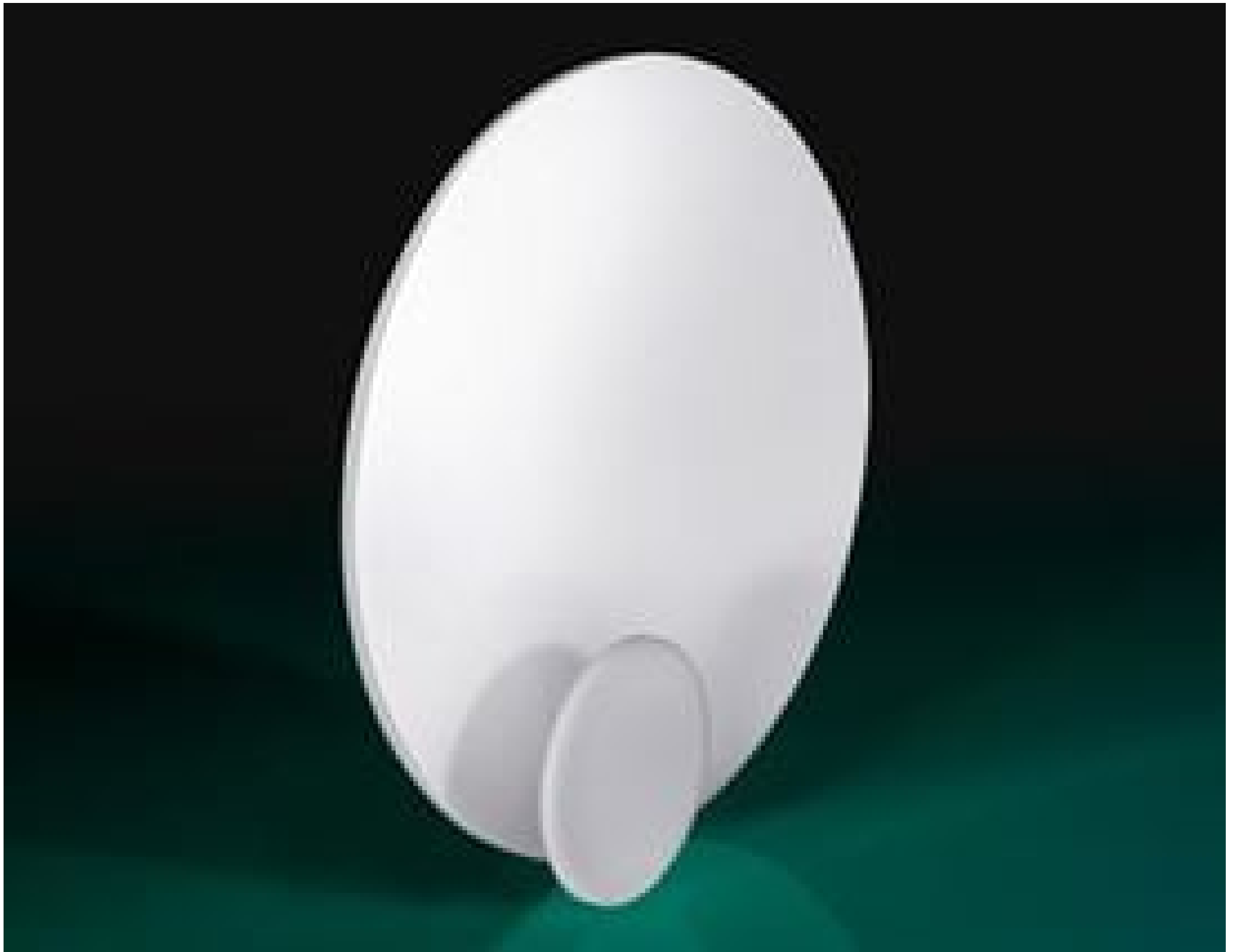
White Diffusing Glass