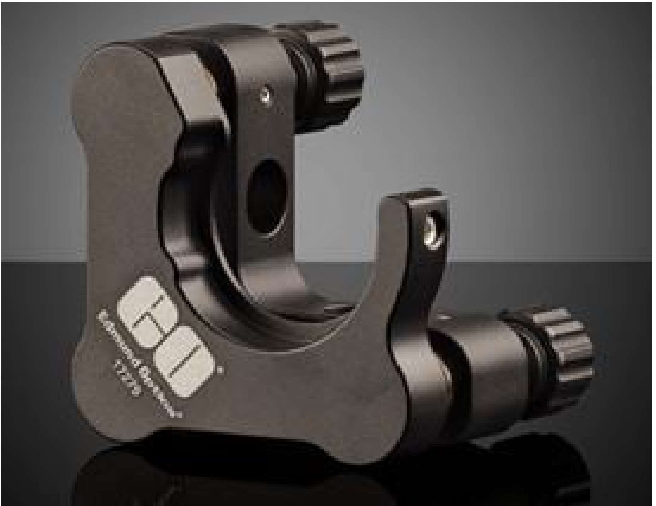
#17-279, 25.0/25.4mm Optic Dia., E-Series Clear Edge Kinematic Mount