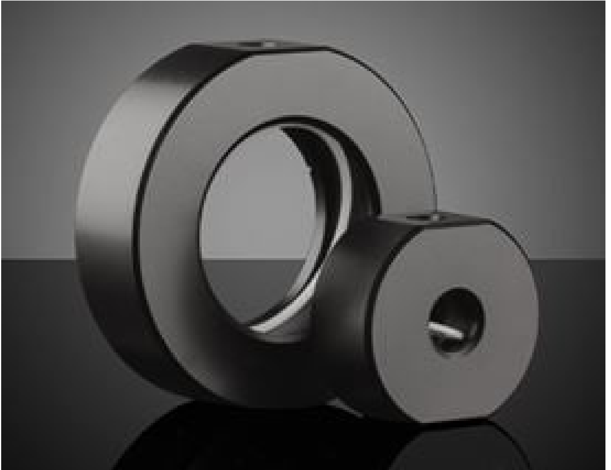
Optic Component Mounts