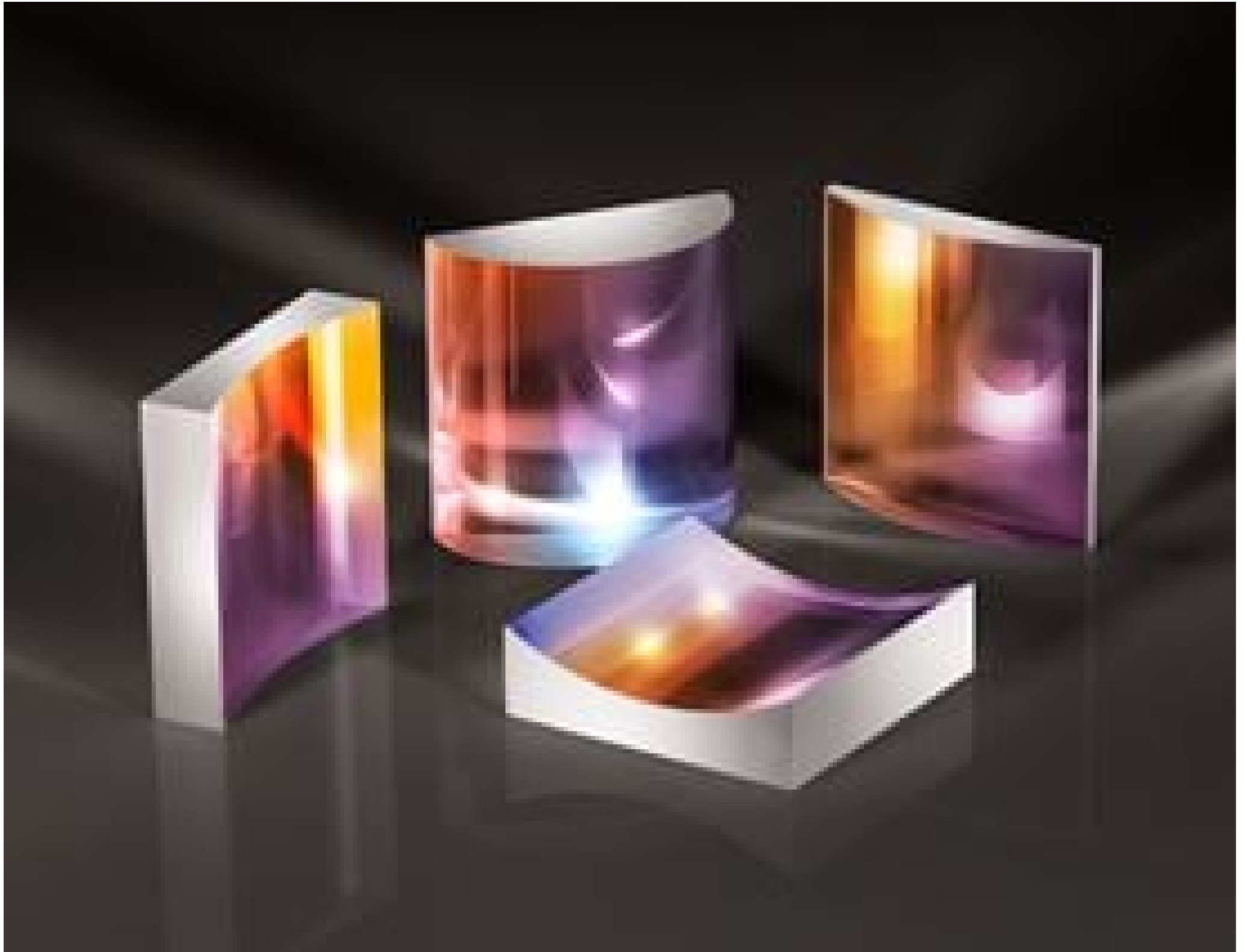
TECHSPEC Beam Shaping Fused Silica Cylinder Lenses