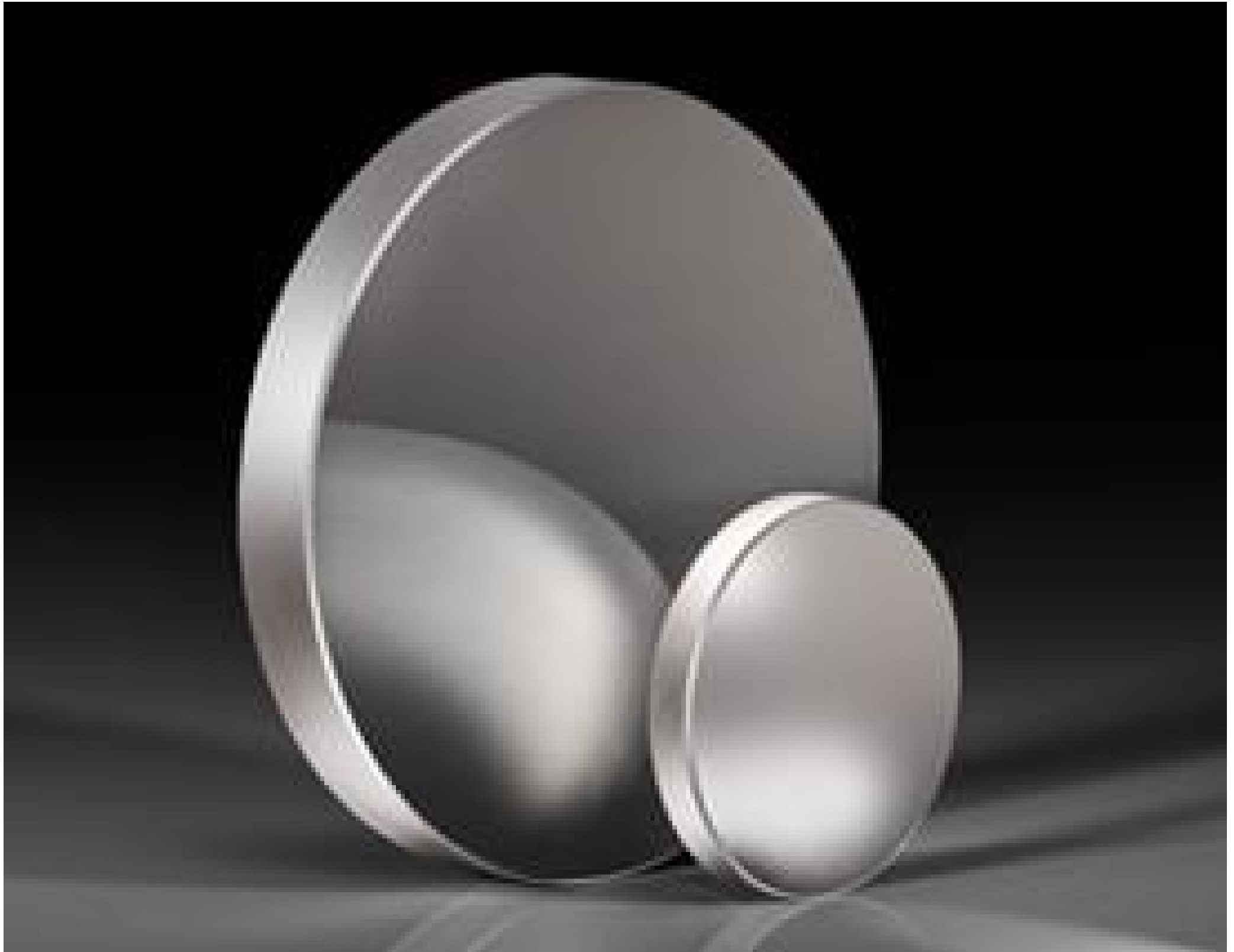
TECHSPEC® Ultrafast-Enhanced Silver Concave Laser Mirrors