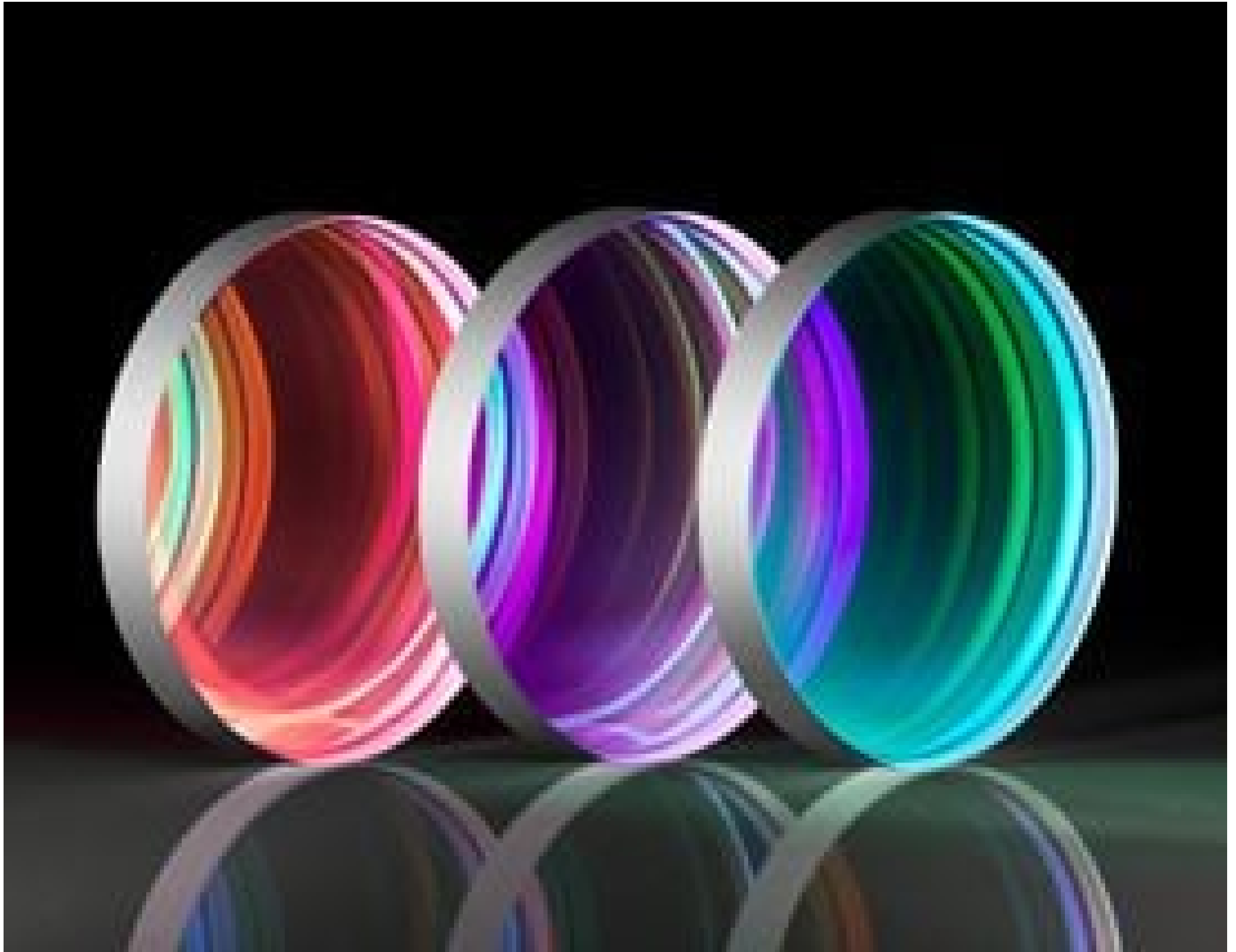
Ultrafast Harmonic Separators