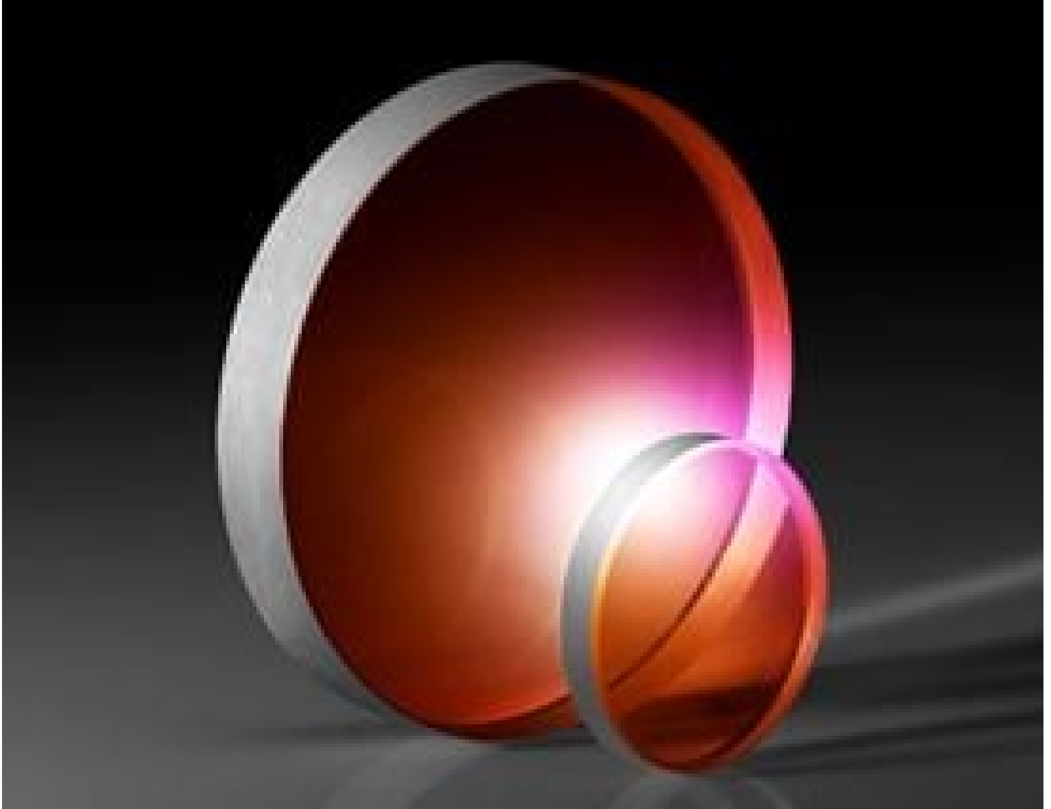
Calcium Fluoride (CaF 2 ) Wedged Windows