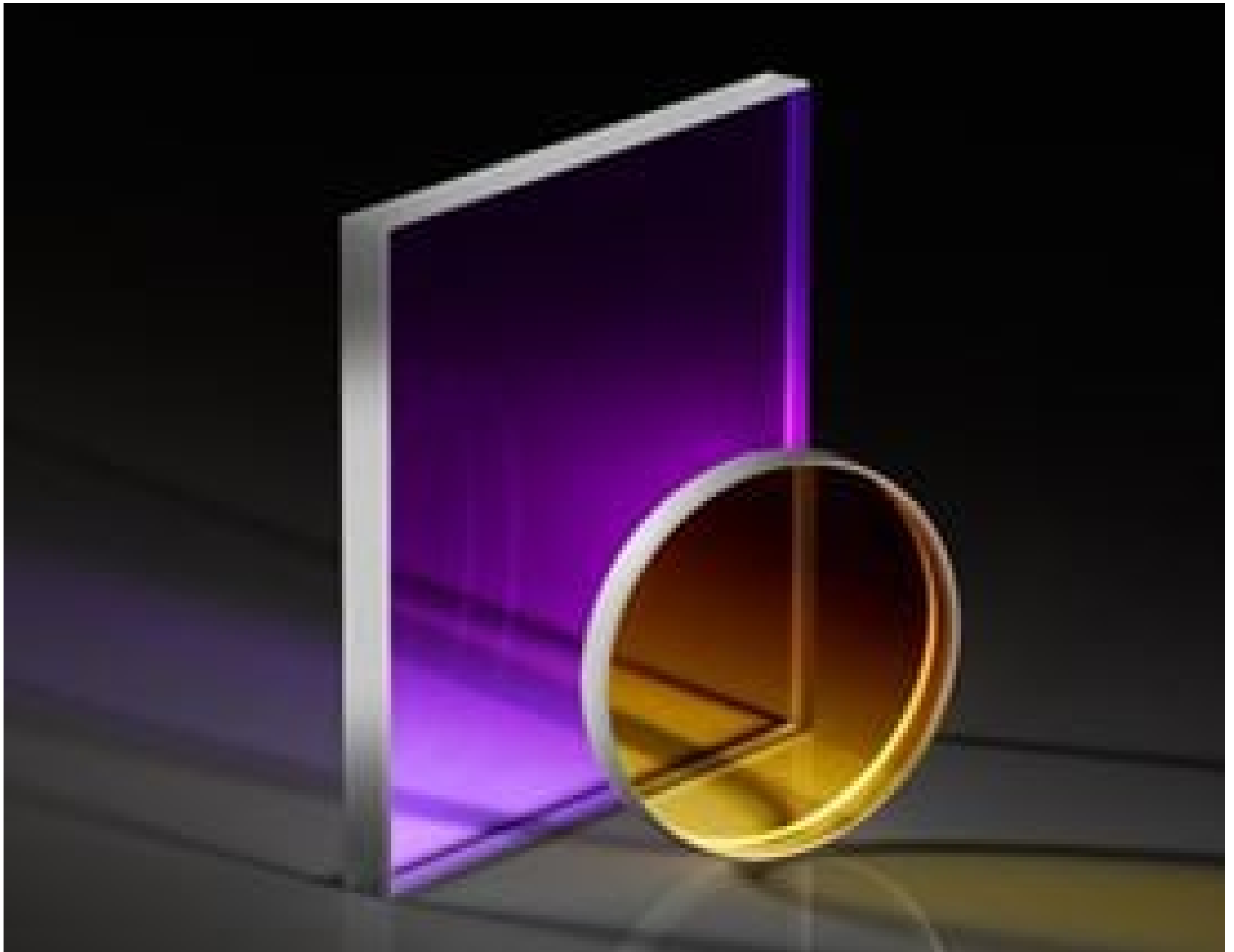
TECHSPEC® 1λ UV Fused Silica Windows