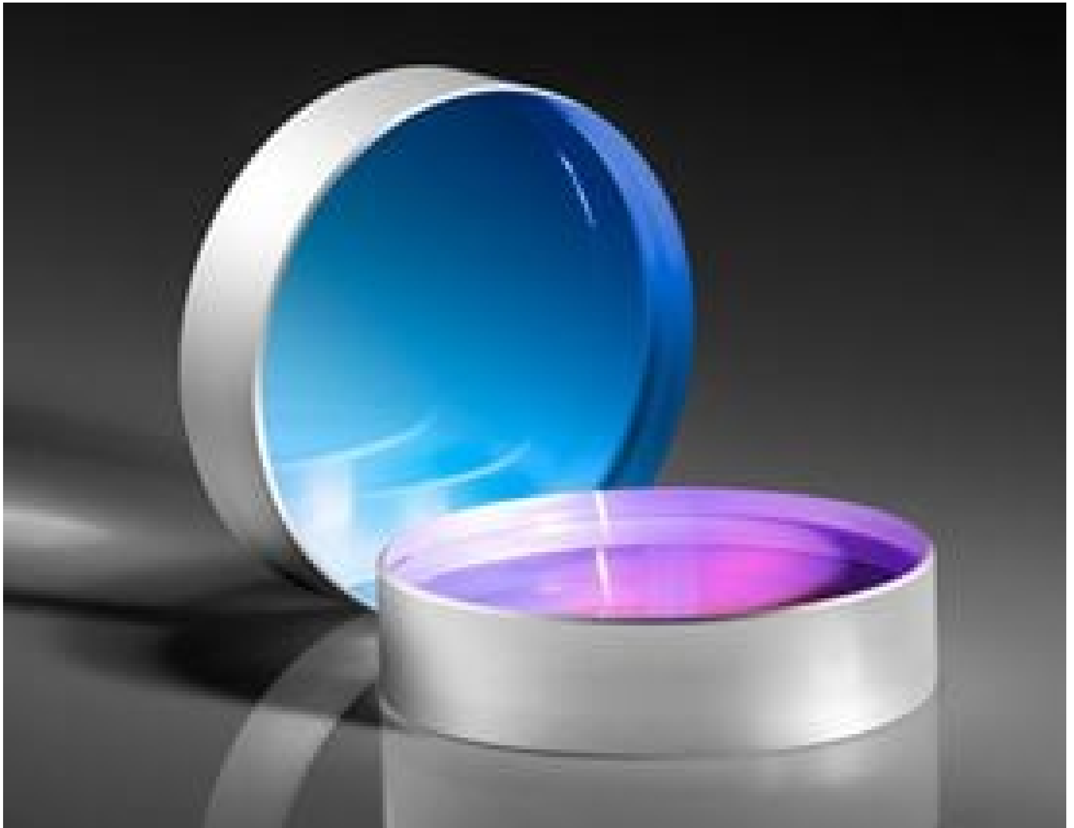
TECHSPEC® Nd:YAG Laser Line Beam Samplers