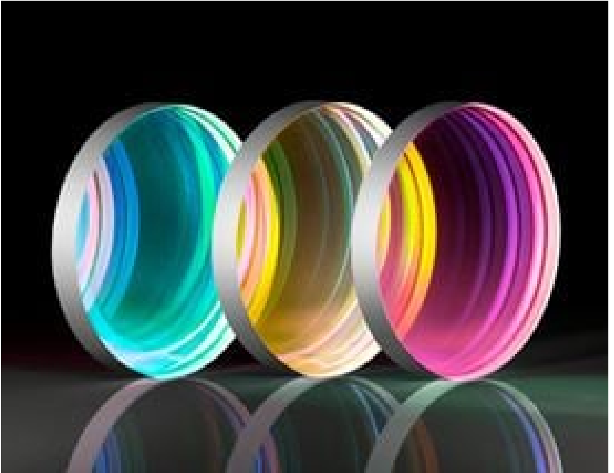
TECHSPEC® Ultrafast Beamsplitters