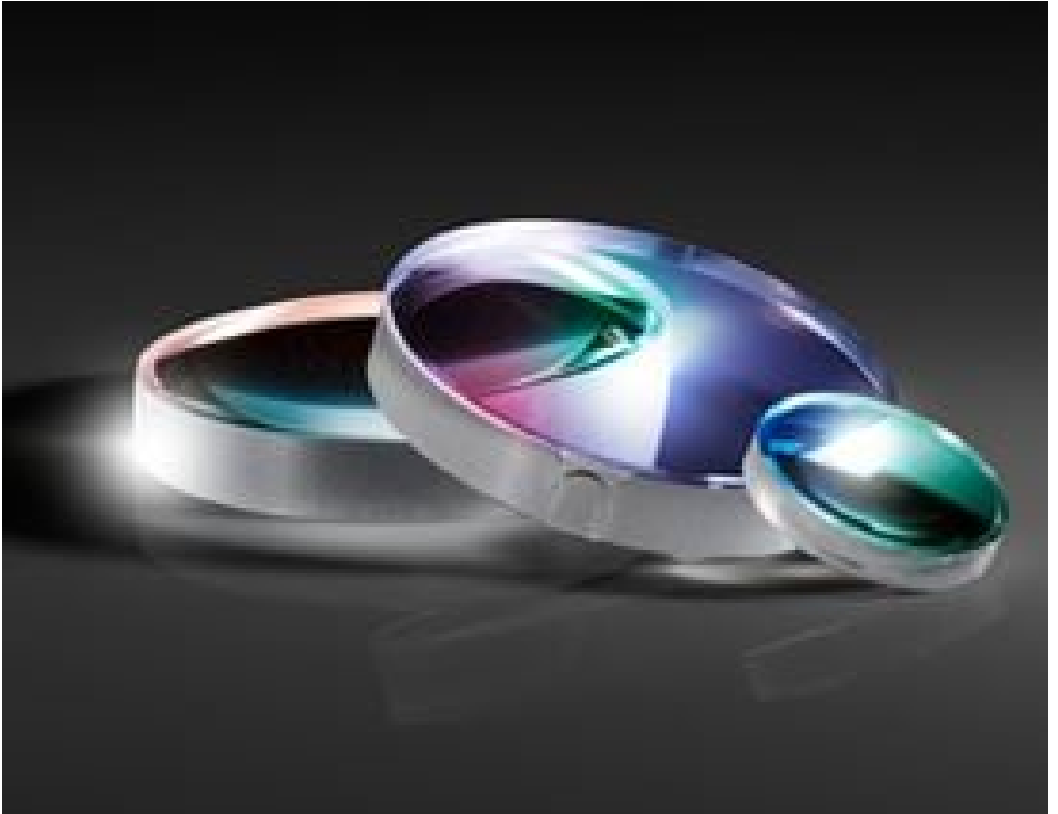
Molded Acrylic Aspheric Lenses