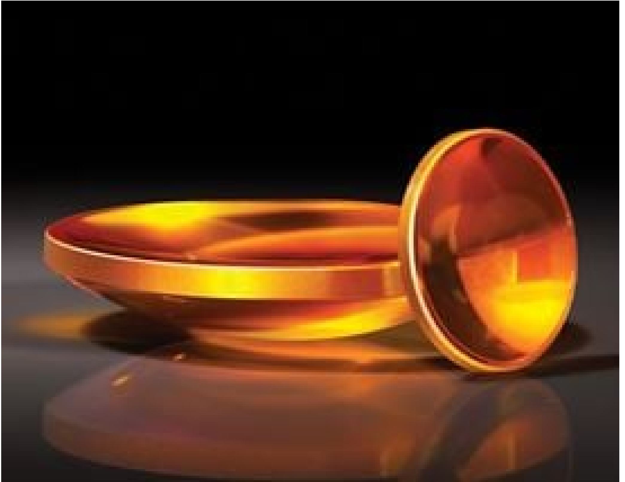
TECHSPEC Zinc Selenide (ZnSe) Aspheric Lenses