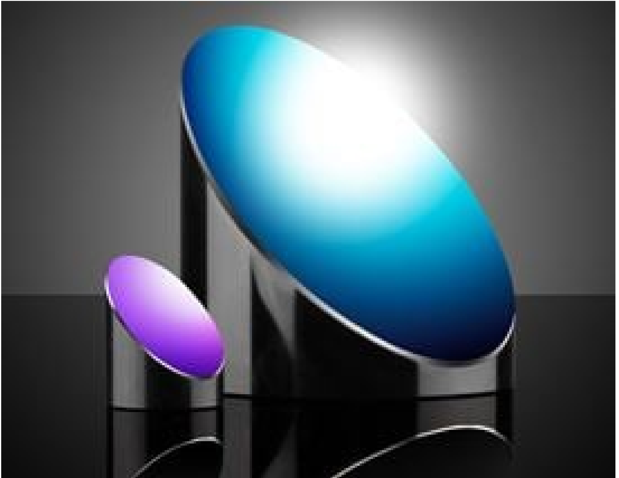
TECHSPEC® Laser Line Coated Off-Axis Parabolic (OAP) Mirrors