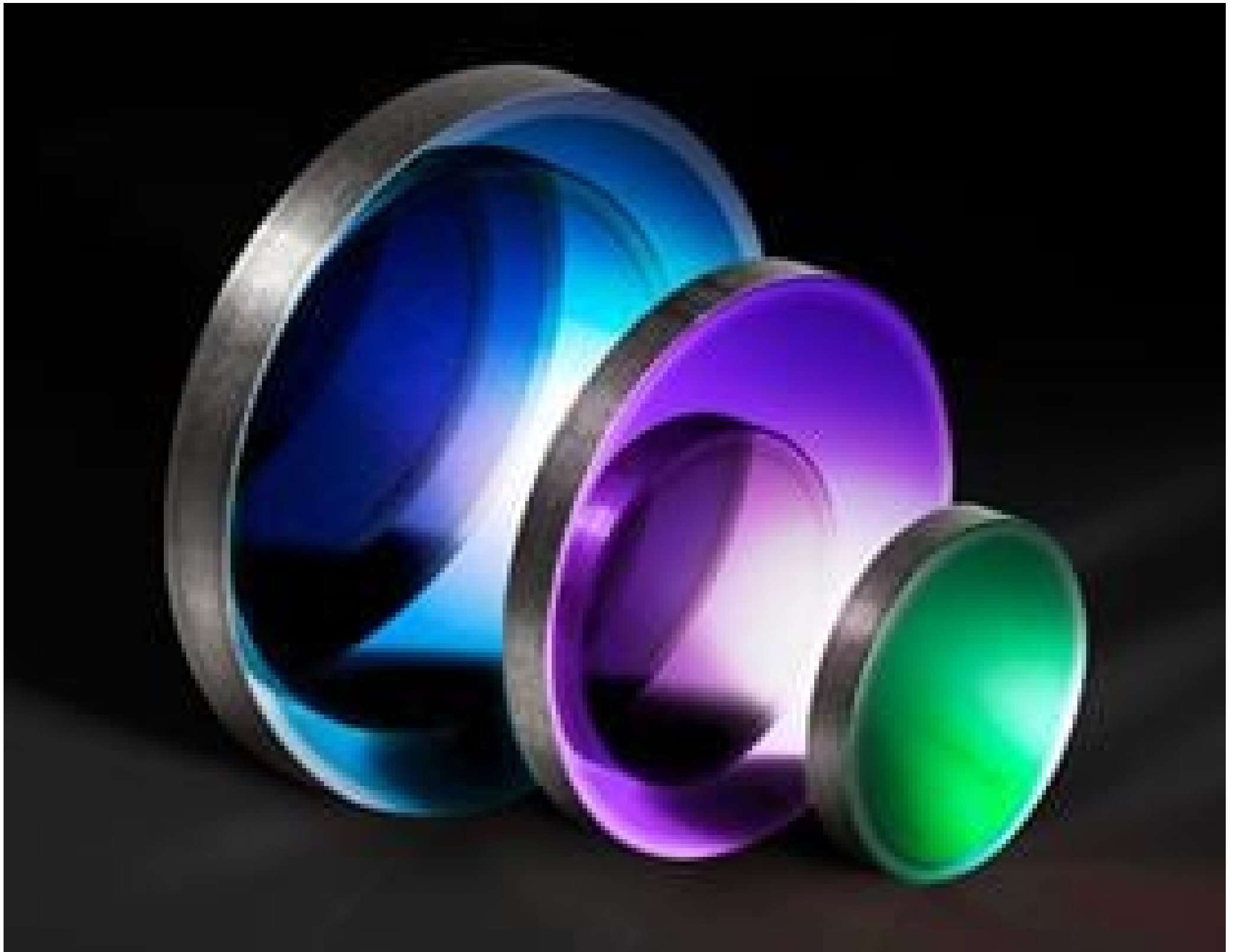
Germanium (Ge) Windows