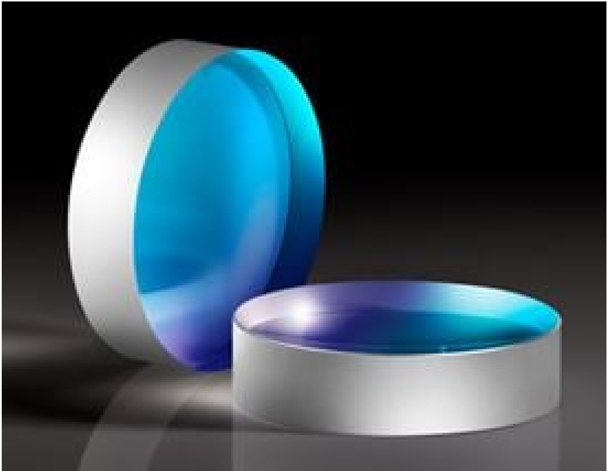
Laser Line Concave Mirrors