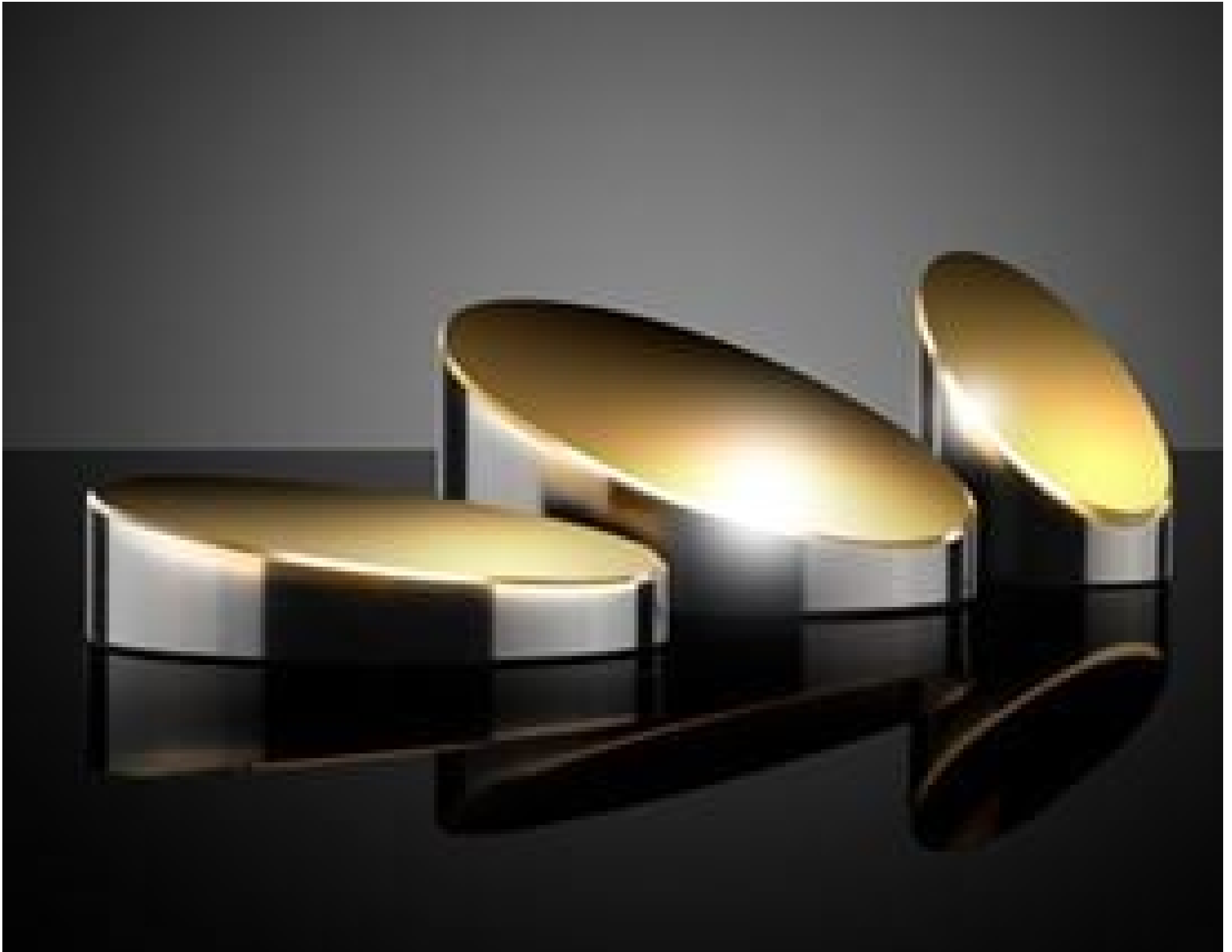
TECHSPEC Gold Off-Axis Parabolic Mirrors