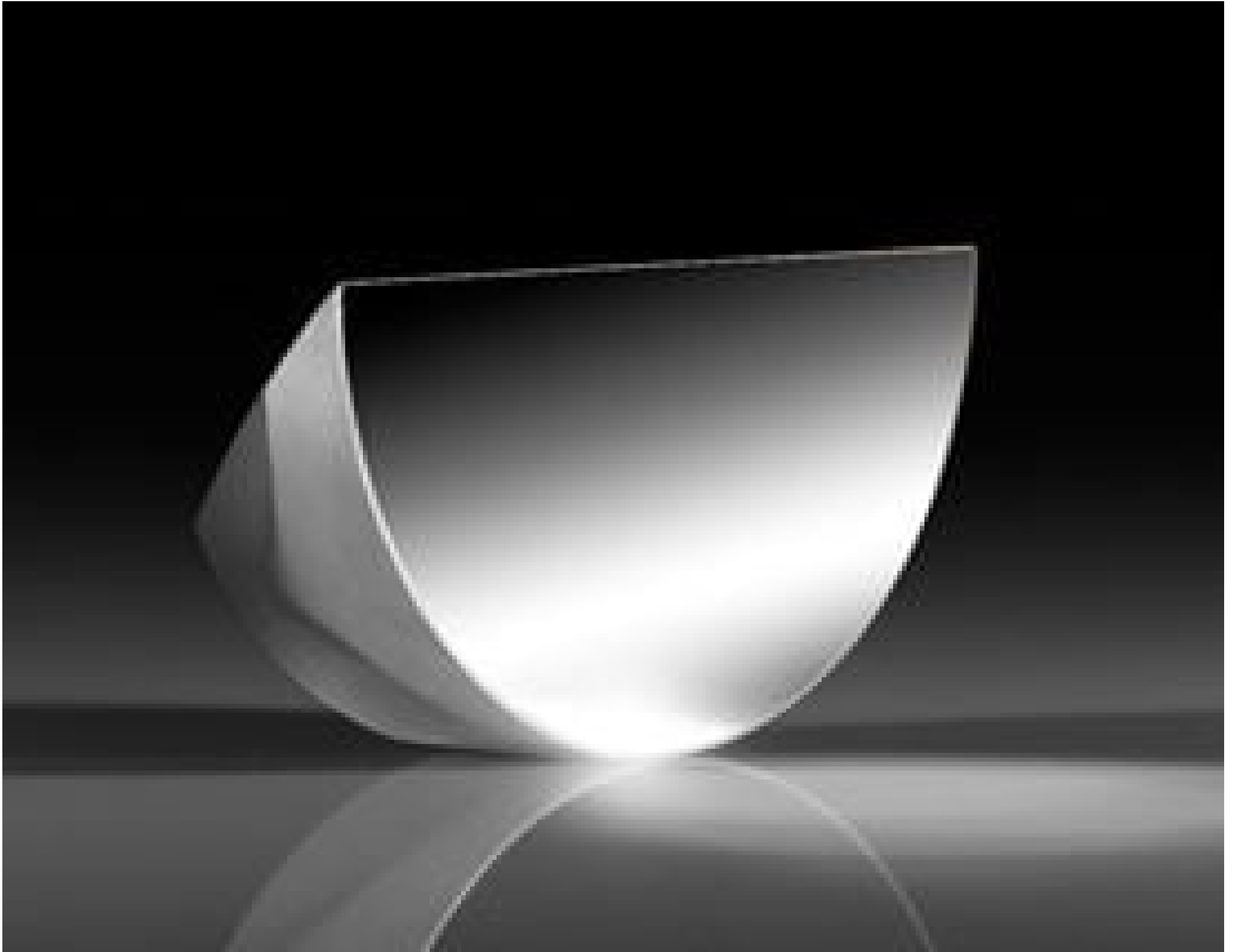
25.4mm Enhanced Protected Silver \lambda/10 D-Shaped Pickoff Mirror, #36-137