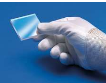
Werkzeuge zur Handhabung von Komponenten

Diese Optiken erfordern eine spezielle Behandlung, um Schäden zu vermeiden und eine lange Lebensdauer zu garantieren. Eine korrekte Handhabung, Reinigung und Lagerung sind für die optische Qualität extrem wichtig. In unserem Wissens-Zentrum finden Sie eine Schritt-für-Schritt-Anleitung zur Optikreinigung und Erklärungen zu bewährten Verfahren. Wenn Sie weitere Unterstützung benötigen, senden Sie uns gerne jederzeit eine E-Mail oder chatten Sie mit unserem technischen Support.