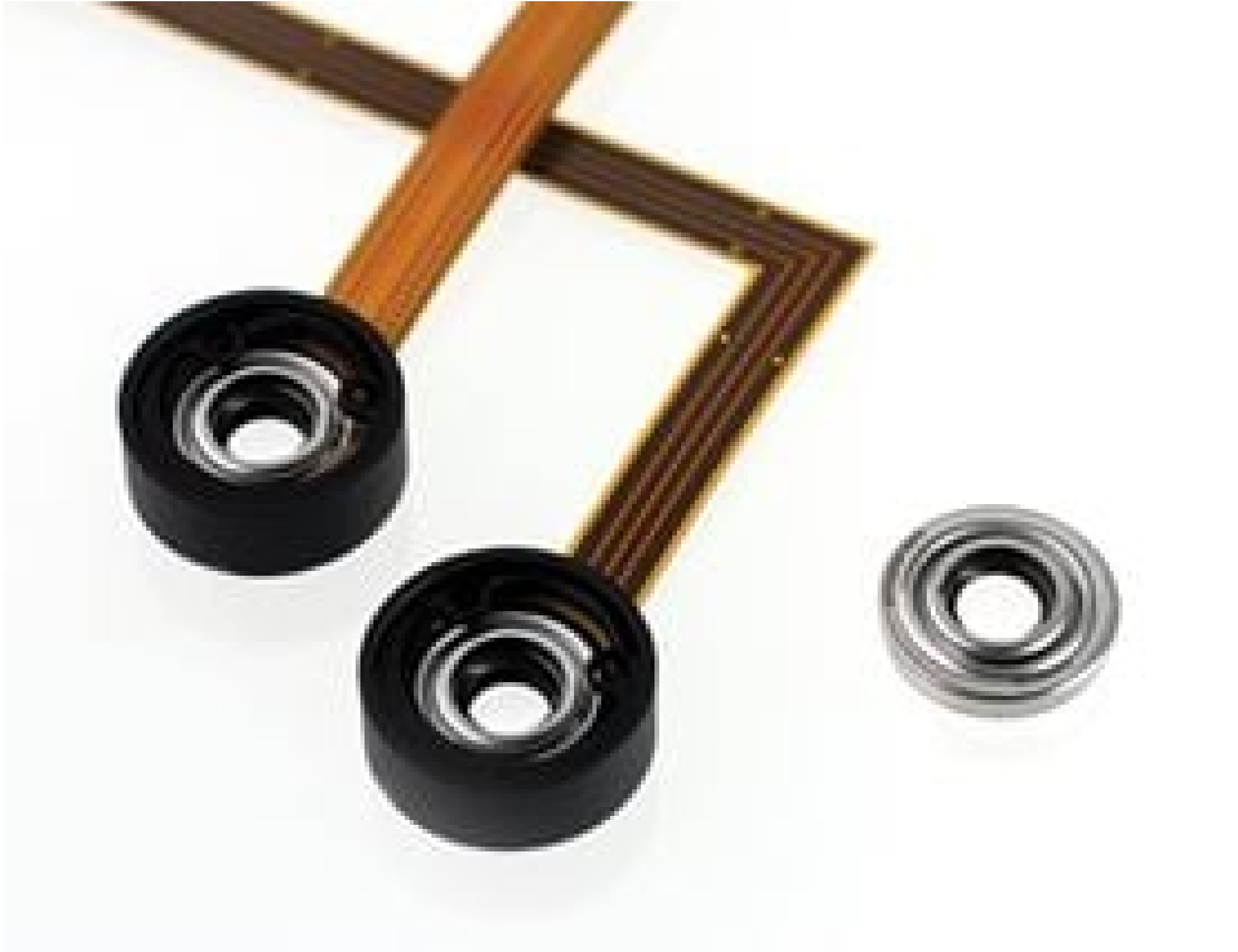
Corning® Varioptic® Variable Focus Liquid Lenses