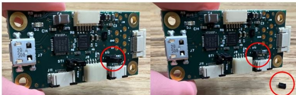
Jumper at ST2 plugged in